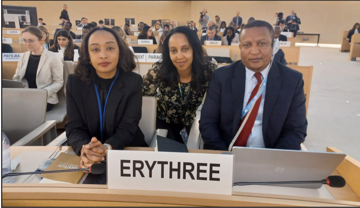
وشدد مندوب ارتريا ، على ان فرض بعض الدول تدابير أحادية الجانب يتعارض مع تعزيز حقوق الإنسان و ميثاق الأمم المتحدة والعلاقات الدولية. حقوق الانسان.

ملموس بصياغة سياسات تنموية تركز إلى العدالة الاجتماعية والاعتماد على الذات.