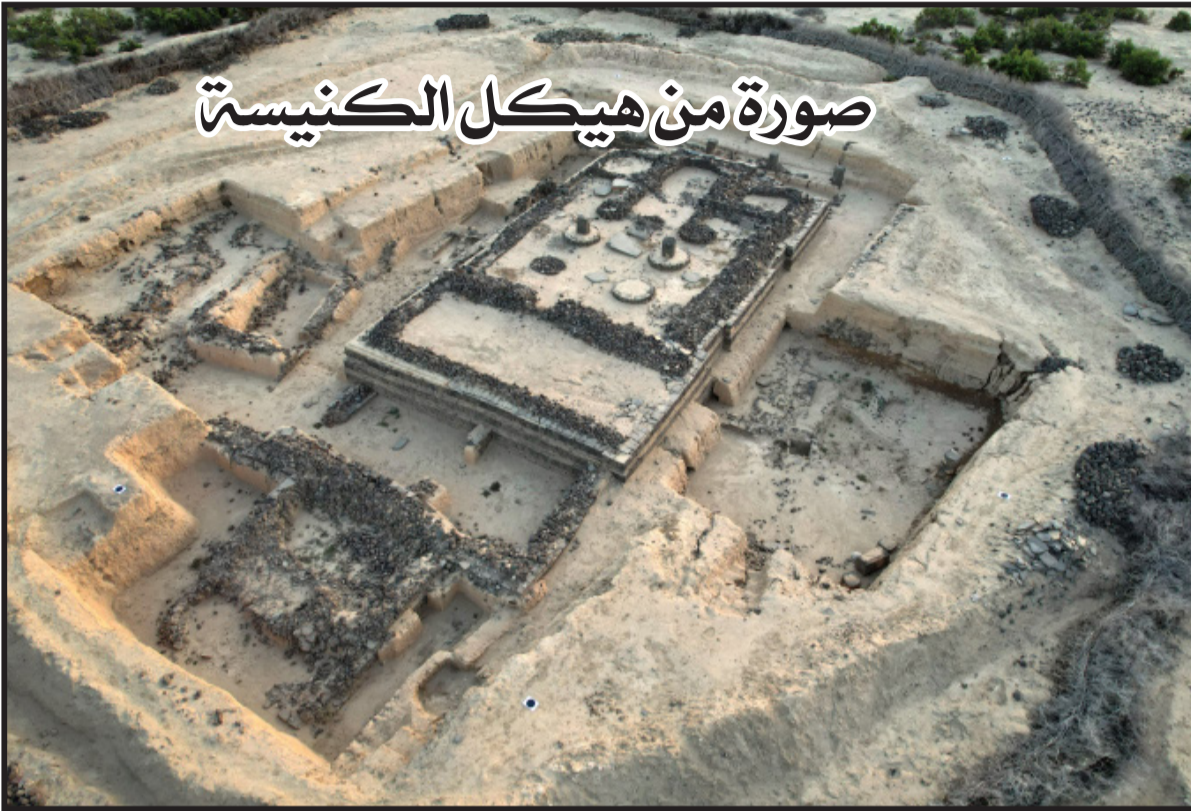
صورة من هيكل الكنيسة

الاحمر في العصور القديمة، وأعتقد ان هذه الحملة مهمة بشكل خاص، لقد وجدنا الكثير من الاشياء الجديدة والاهم من ذلك كله اننا لدينا الاجابة بالنسبة لبعض المعضلات في العام السابق، والتي لم يتم حلها. والان لدينا الاجابة النهائية والاهم من ذلك كله بالنسبة للغرفة التي