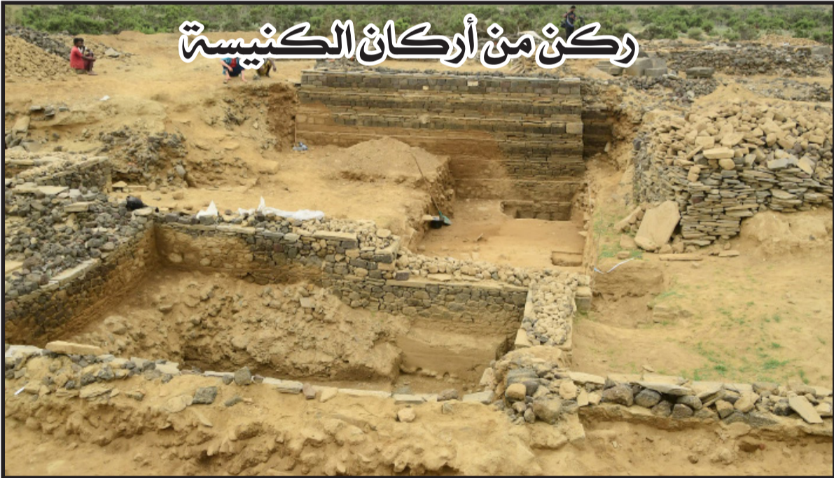
ركن من أركان الكنيسة

إلى تقسيم عدوليس الى 9 مواقع، في مساحة حوالي 40 هكتاراً. عمل فريق علم الآثار الارتري بمنطقة عدوليس