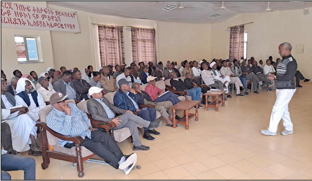
المماثلة وحل مشكلة نقص الصرافين في المدارس عاجلا.

لتحسين العملية التعليمية. واقترح المشاركون توسيع نطاق التدريبات