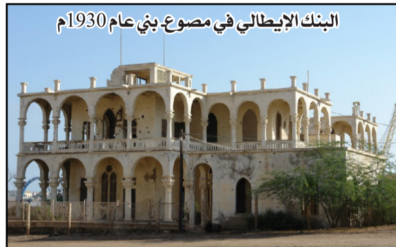
البنك الإيطالي في مصوع بني عام 1930م

بناء الدولة . ففي زمن وجيز شرعت الحكومة الإيطالية في بناء موانئ كبيرة ومراسي صغيرة ومطارات وطرق في إرتريا بالإضافة الى مد السكك الحديدية والتلفريك وتوفير المواصلات البرية، وبإختصار فقد مهدت إيطاليا أرض وبحر إرتريا لتنفيذ مهمتها الإستعمارية وأنشأت أضف الى ذلك مراكز للإمداد بالطاقة ومدت وسائل الإتصالات السلكية والتلغراف وبنيت المصانع والمؤسسات الإنتاجية الصغرى وشركات الصيانة المختلفة، كما اجرت مسوحات