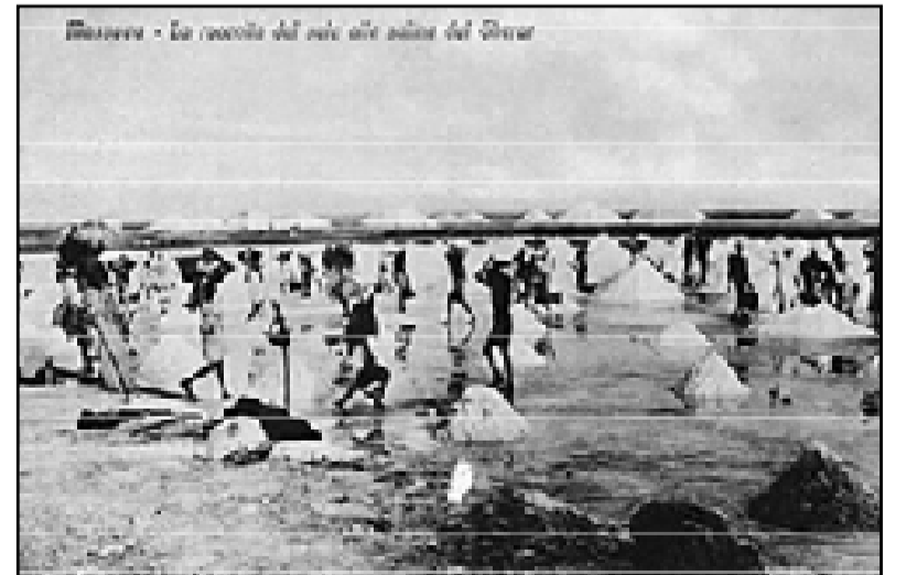
Massawa - La raccolta del sale alle saline del Ghir

ان هدف إيطاليا حينها كان إنشاء مستعمرة واسعة تضم أراضي إثيوبيا وإرتريا والصومال الإيطالي وبناءاً على ذلك إختارت إيطاليا إرتريا كنقطة إنطلاق لتنفيذ هذا الهدف، وأنفقت اموال طائلة للإسراع بوتيرة