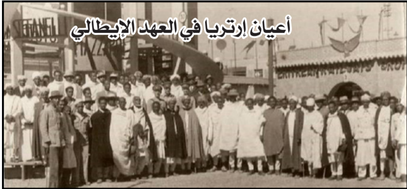
أعيان إرتريا في العهد الإيطالي