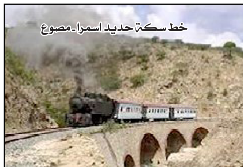
خط سكة حديد أسمرا-مصوع

مدارس تدرس حتى الصف الرابع فقط وتخرج أفراد يجيدون اللغة الإيطالية ليكونوا حلقة وصل بين المواطنين والمستعمر الإيطالي، وفي ذات السياق بذلت الإدارة الإيطالية كل ما في وسعها لنشر ثقافتها في اوساط المواطنين والتأثير على الثقافة الوطنية الإرترية، ونتيجة للإستثمار الكبير الذي وظفته إيطاليا في إرتريا شهدت البلاد تغيرات إجتماعية وإقتصادية سريعة وظهرت في الساحة مجتمعات حديثة ليتحول الهيكل الإجتماعي للمجتمعات الإرترية الى الرأسمالية التي كانت حينها في الصدارة والواجهة، ومع مرور الوقت ساهم ذلك في خلق شعور وطني موحد وبدأت المفاهيم الوطنية تغلغل في اوساط المواطنين بقوة، ونتيجة لذلك بدأ الإرتريون في مقاومة سياسة التجنيد الإجباري والظلم والإضطهاد لاسيما قوانين الفصل العنصري