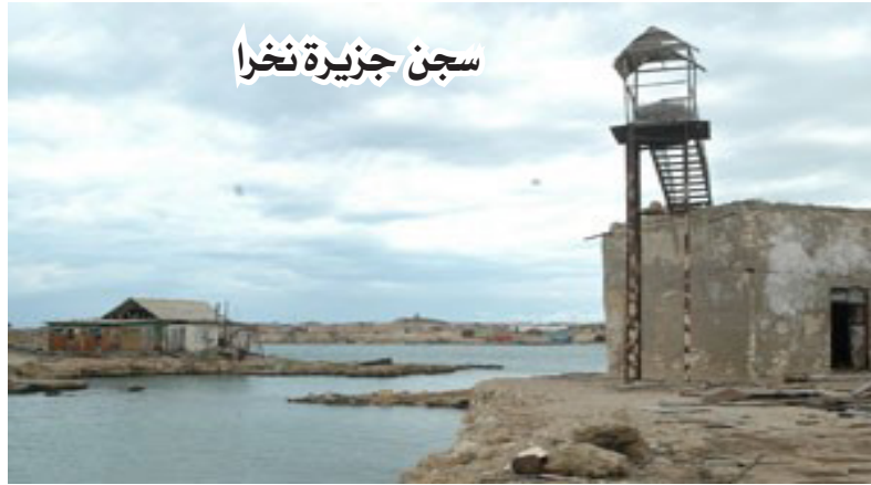
سجن جزيرة نخرا

لدرجة انه كان يضع حبيبات الذرة الساخنة جداً في آذان الناس لتعذيبهم مايؤدي الى اصابتهم بالصمم وانتشرت مقولة في تلك الفترة تقول " ان من عاش في زمن ووي قضى وقته ينادى ووي". في عام 1870 قام ملك اثيوبيا بارسال