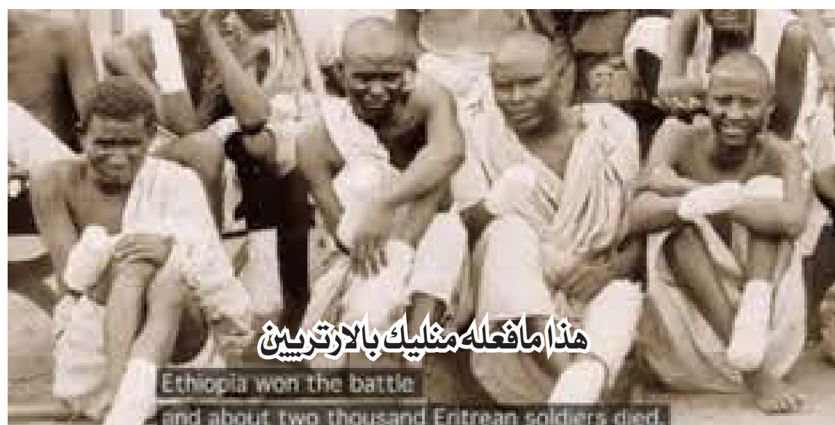
هذا ما فعله منليك بالارتريين

وبسبب الغزوات وعمليات النهب المتكررة، تعرض شعب إرتريا الكادح،