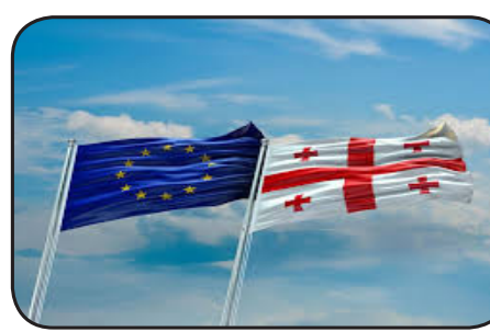
احترام الديمقراطية والسيادة الكاملة

للدول الأعضاء". وكان الوفد الجورجي للجمعية البرلمانية لمجلس أوروبا الذي يضم نائبة رئيس برلمان الجمهورية ، ونواب آخرين، بالإضافة إلى البرلمانيين الاحتياطيين ، وراي قدموا طلب سحب عضويتهم إلى رئيس الجمعية البرلمانية، ثيودوروس روسوبولوس.