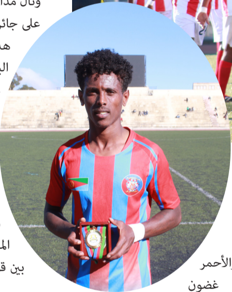
البحر الأحمر في غضون