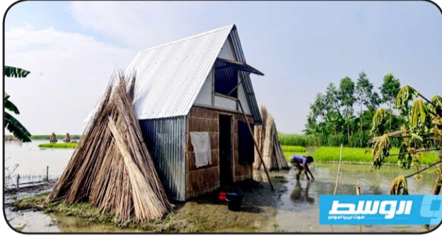
مختلف أنحاء البلاد.