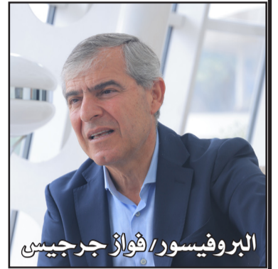
البروفيسور / فواز جرجيس

في البداية بروفيسور فواز جرجيس اهلا بك في بلدك الثاني ارتريا وشكرا لك لاتاحتك الفرصة للصحيفة لاجراء هذا الحوار . باعتبارك متخصص في سياسة الشرق الاوسط والعلاقات