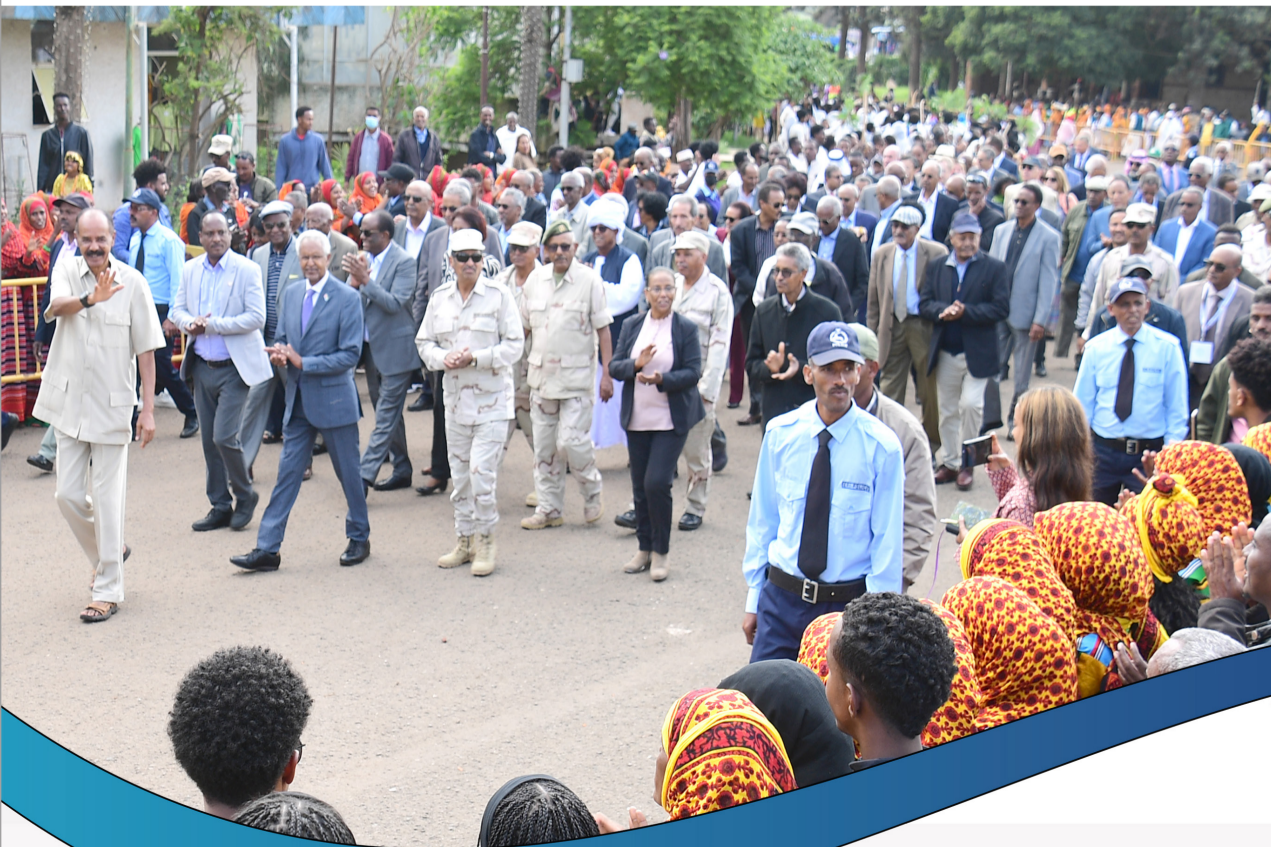
تصميم: تازاز أبرها تصوير: تازاز أبرها أخيلو زرازقي كبروم ظهاي أبرهام بين