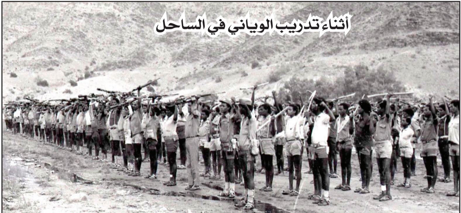
أثناء تدريب الوياني في الساحل

فضائح ونهبها واسع في أجزاء مختلفة من إرتريا الحالية )، كانت هناك عائلات أجبرت على عبور حدود مرب إلى تقراي وأجزاء أخرى من وسط إثيوبيا. وأيضاً منهم من استقر هناك بعد انتقاله إلى مناطق مختلفة من إثيوبيا عن طريق الرعي. كان هناك أيضاً العديد من الجنود الإرتريين الذين