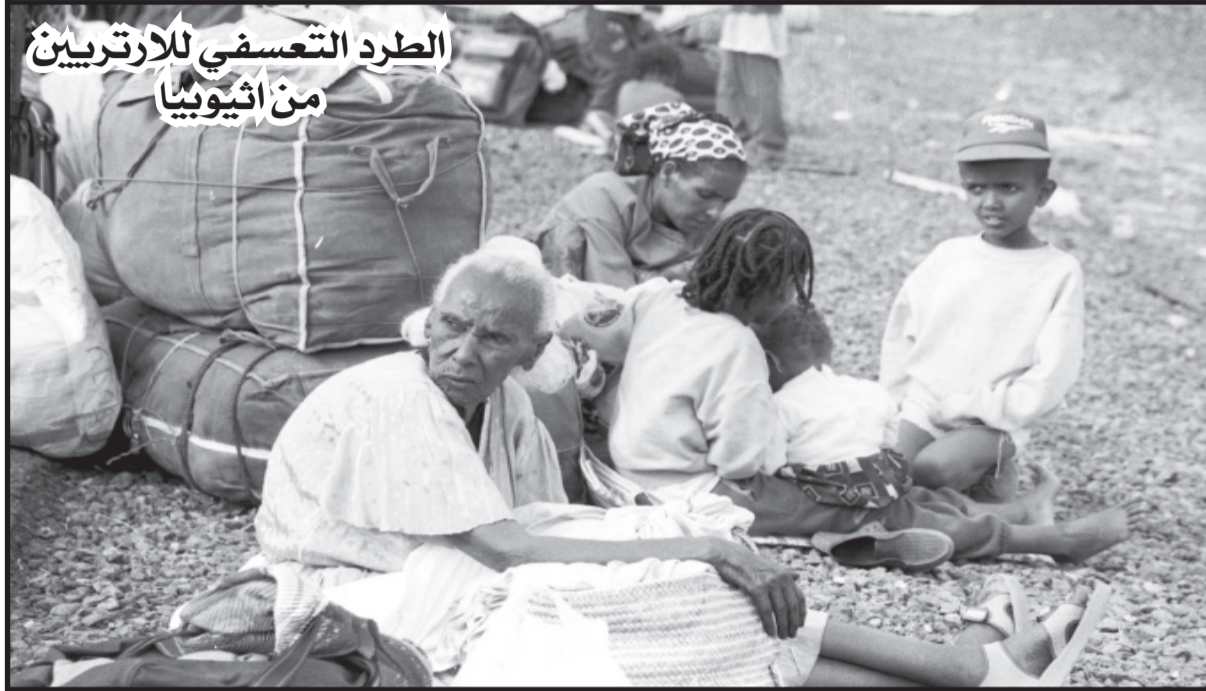
الطرد التعسفي للارتريين من اثيوبيا

بتصريحات تنتقد هذه الممارسات، فعلى سبيل المثال شبه السيد/ ناتانيل كلاين، وهو أسترالي متخصص في القانون ومحامي المحكمة العليا لجنوب أستراليا طرد الإرتريين بأنه شبيه بترحيل اليهود من ألمانيا النازية قبل الحرب العالمية الثانية. وذلك في تصريح ادلي به لوسائل الإعلام الأسترالية في 9 سبتمبر 1998 بعد إجراءه لمقابلات موسعة مع أكثر من 60 مواطن إرتري تم طردهم من اثيوبيا وإعداد تقرير من 50 صفحة لتقدمه إلى الحكومة الأسترالية، لكن مثل هذه التصريحات المحدودة لا يمكن مقارنتها بالانتهاكات الصارخة لحقوق الإنسان التي ارتكبتها نظام الوياني.