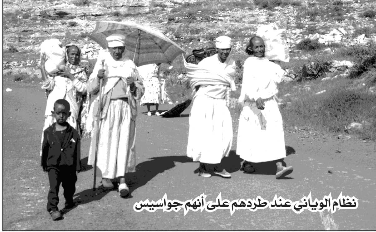
نظام الوياني عند طردهم على أنهم جواسيس

الشعبية لتحرير تقراي )، و 19.6 % من تدعمهم مالياً ، و 45.2 % منهم من ساهموا في الانتخابات لصالح نظام ( الجبهة الشعبية لتحرير تقراي ) ، هل تحقد على شخص يدعمك ويتعاون معك أم من ينظر اليك بغيرة وحسد ، لكن الخيانة والغدر هي طبيعة الوياني... لا يوجد هناك ما يسمى الضمير عندهم .