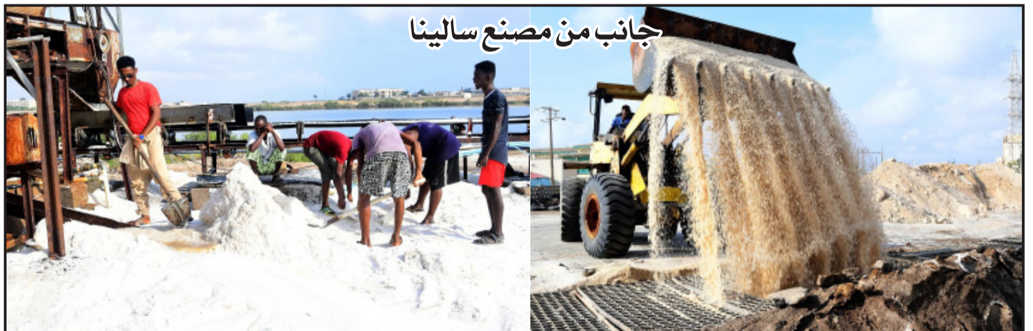
جانب من مصنع ساليينا

في البدء أود أن أشكر وزارة الاعلام لإتاحتها الفرصة لي للتحدث عن المصنع، وما تقدموه من مجهود لنشر برامج التنمية في البلاد.