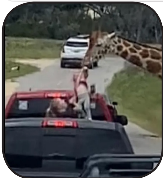
الطعام من يدي بيزلي.

وفي لمح البصر، أمسكت الزرافة بقميص الفتاة الصغيرة ونزعتها من يد أمها ورفعتها في الهواء.