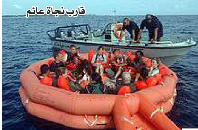
قارب نجاة عائم

بصفة عامة يمكن القول من أجل النجاة من مخاطر الطوارئ البحرية والبحث عن السلامة يستدعي اللجوء إلى المنح الآمن وسترة النجاة كأقل تقدير حملها وارد ومألوف وإذا ما تخطى الحدت تجاوز الحصول على لوازم النجاة وعدمه في الحال الإستفادة من الأشياء الراسية حوله والتعلق بها أو نفض الملابس أو غيره من وسائل الهروب لحين وصول الإسعافات الأولية.