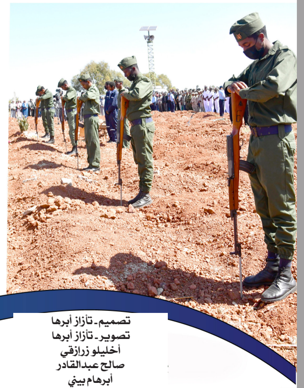
تصميم - تازاز أبرها تصوير - تازاز أبرها أخيلو زراقي صالح عبد القادر أبرهام بيبي