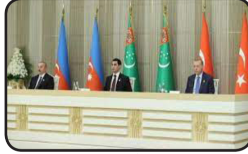
جديدة عبر تركيا.

ويطمح أردوغان إلى استغلال موقع تركيا على أطراف البحر المتوسط وأوروبا من أجل تحويل البلاد إلى أحد أهم المراكز العالمية لتجارة الطاقة.