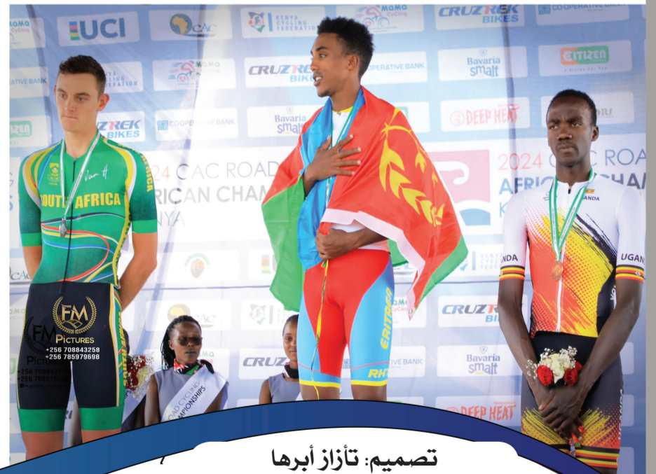
تصميم: تازاز أبرها