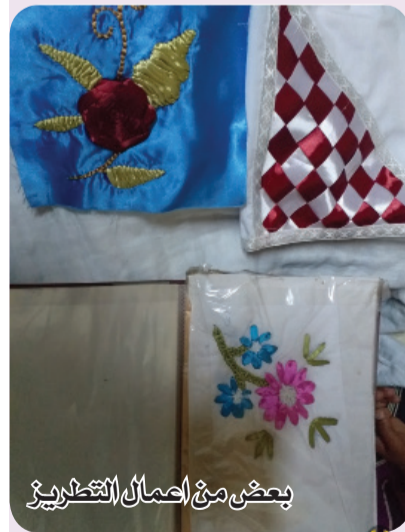
بعض من أعمال التطريز

اقوم بتدريس الفتيات الأعمال اليدوية التي يردنها، لذا في البداية اقوم بشرح انواع الاعمال لهن قبل كل شئ وبعد ذلك اترك لهن حرية الاختيار بسؤالهن عن نوعية الاعمال التي يردن بحيث يسهل عليهن دراسة مايلو لهن بدون اي مشكلة حسب هواياتهن والعمل بها. حيث لا استطع