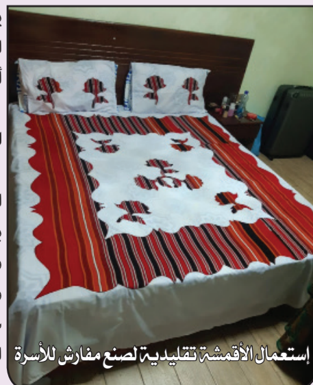
استعمال الأقمشة التقليدية لصنع مفارش للأسرة

اول مرة طرزت فيها كنت صغيرة في السن فقامت امي بتعليمي أسس الخياطة، لذلك هي معلمتي الأولى، وفضلها وصلت الى هذه المرحلة، حيث