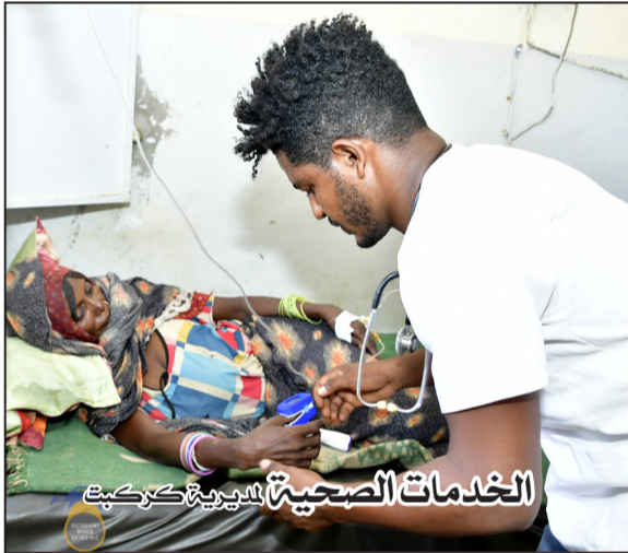
الخدمات الصحية بالمديرية كركبت

يوجد لدينا ما يقارب 36 من الوكلاء بالقرى لأمراض الملاريا، والذين تديرهم وحدة السيطرة على مرض الملاريا، ولاتتخصر مهمتهم على هذا المرض فقط، بل يوجد بينهم وكيل يتابع مرض السل بجانب العمل الذي يؤديه، ويقوم بفحصهم واذا استدعى الامر يقوم بنقلهم الى المؤسسات الصحية، وعدا ذلك يقومون بمتابعة إستخدامات المراحيض ودورات المياه، بجانب ذلك يقومون بمراقبة ممارسة العادات الضارة مثل ختان الاناث التي يمكن القول بأنها اندثرت تماماً، ولكن لكي لاتعود مره اخرى يقومون بإجراء وتنظيم الاجتماعات بالتعاون مع كبار واعيان القرى والمجتمع لتنويرهم بعدم ممارستها وسبل مكافحتها، لذا يقوم هؤلاء