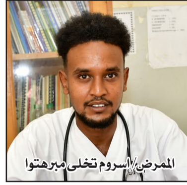
المرضى/ اسروم تخلى مبرهتوا

اذا كانت هناك حالات يصعب علاجها، كيف يتم نقلها الى المراكز الطبية الاخرى؟ هناك نوعين لحالات النقل، ففي الخمس