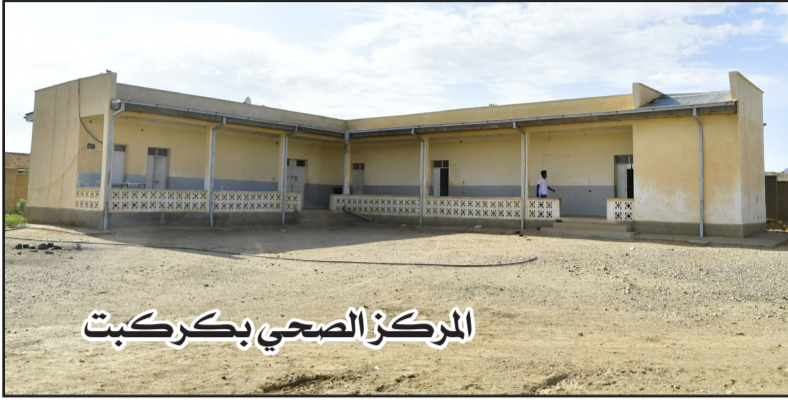
المركز الصحي بكركبت

المديرية بعض القصور في هذا الجانب كيف تقييم لنا برامجكم التوعية بهذا الاطار؟ هذه المديرية معرضة لرياح الخماسين، لذا نقوم من جانبنا بالتوعية للشعب باستمرار، ومن ضمن احدي هذه البرامج، بناء مراحيض عامة وخاصة، الى جانب ذلك تقوم كل القرى بتخصيص يوم واحد في الاسبوع للقيام بحملة النظافة العامة، وحتى المرافق الصحية تتعرض للآتربة من هذه الرياح، ويتم تنظيفها بشكل يومي، ونقوم ايضا بتخصيص يوم واحد في الاسبوع لاجراء النظافة العام بكافة ارجاء المركز الصحي، ويتم تنظيف كافة ارضية المركز وجدرانه عبر الماء والصابون لاخلاه من كافة الاوساخ لضمان صحة المرضى.