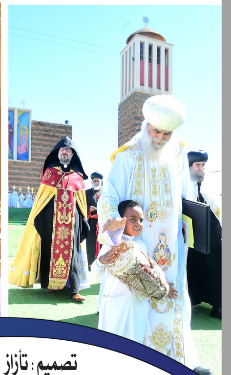
تصميم: تازاز أبرها