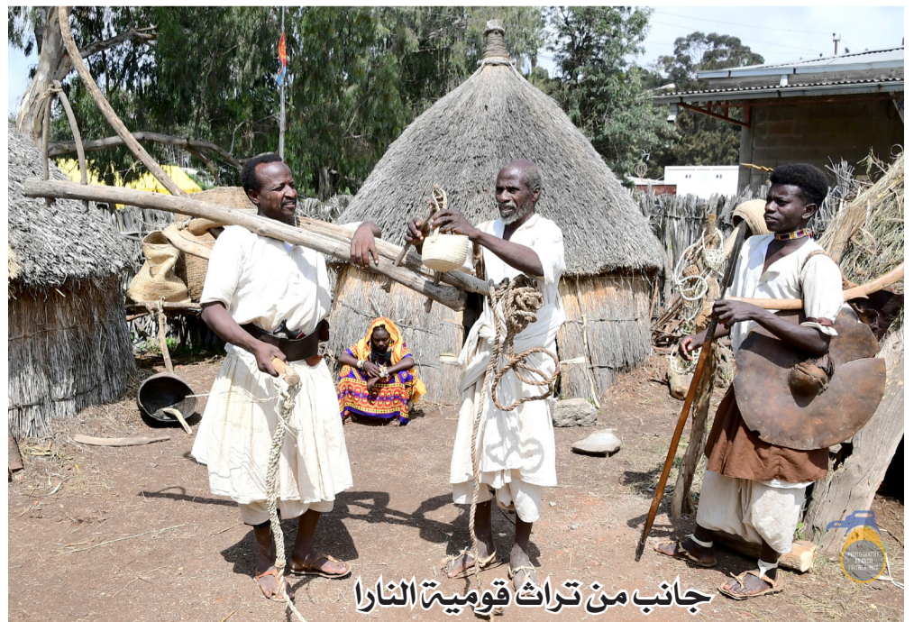
جانب من تراث قومية النارا

العربية، إلا انني اتابع القنوات والإعلام العربي المحلي والدولي، وبعد عودتنا إلى الوطن، سكنت بمدينة بارتو، وتعلمت لغة الكناما، وبعد تخرجي من معهد المعلمين وعملي بالتدريس، في قونجي وضواحيها، أتقنت لغتي الام وتعلمت الكثير عن التراث والثقافة، فقونجي هي ملتقى لجميع لهجات النارا، حيث يأتي الطلبة من جميع القبائل وكانت فرصة عظيمة بالنسبة لي لاعرف الكثير عن مجتمعي. وجميع اللغات الست اعرفها تحدثاً وإستماعاً وقراءة