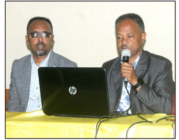
قيم مكتب التعليم بالايوسط

وذكر تسجيل 40617 طالب وطالبة في المرحلة المتوسطة ، نجح 87.8% منهم اضافة الى تسجيل 31937 طالب وطالبة في المرحلة الثانوية لينجح 87.5% منهم لاستكمال دراستهم الأكاديمية. وقدّم مسؤولو