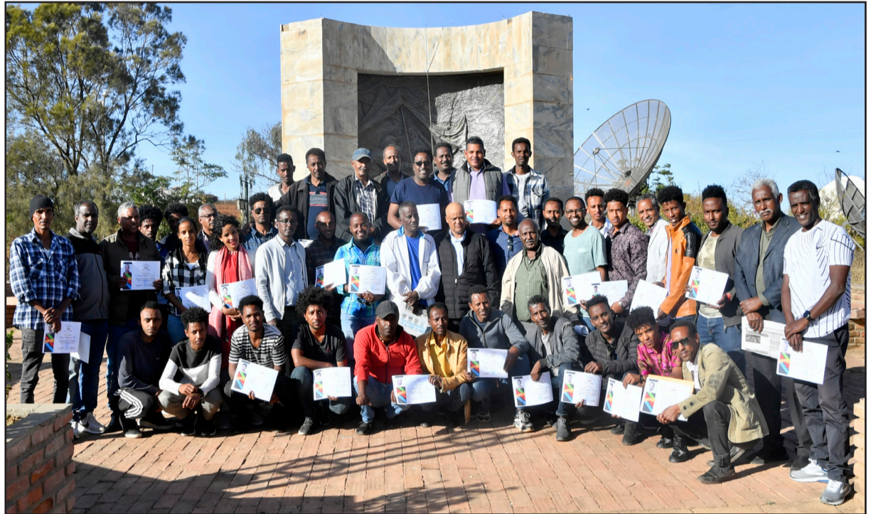
ቅድረት አንፋር እንዴ አደቀበት ዘያድ ከም ለአደም እግል ልግብአ ትወደዩ ለህሌት ጸገም እንዴ ሐመደ፡ ለከሰሰው አምር

ወከለ ትደሐረው፡ እብ ጀሀቱ ውዛረት እዕላም፡ - በቃዕት ምህንት