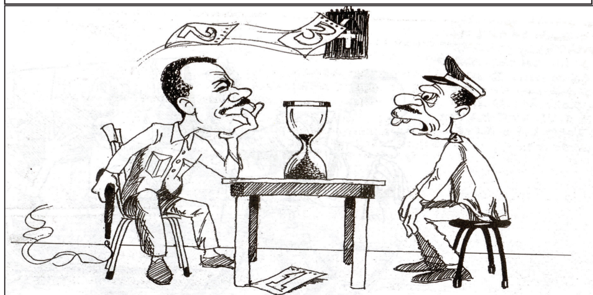
ጎዩ 3 ወርሕ መዋዕድ ኣጥሓል ገላህዮ ሓላፍ፡ መናድሊን ኢበደው፣ ጅግል ልጠደዉ ኢኑ ኖሱ ጅግል ገገፍ ፊኖር ወደዉ = 99 እድ ነገር ፊፕል መካገሎት ስትነኒጅ ጁሀን ጎኪን ጎዝም ጅግል ተህሌ ግ።