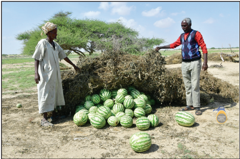
ወደነ ብርጫቅ (ወቂር)