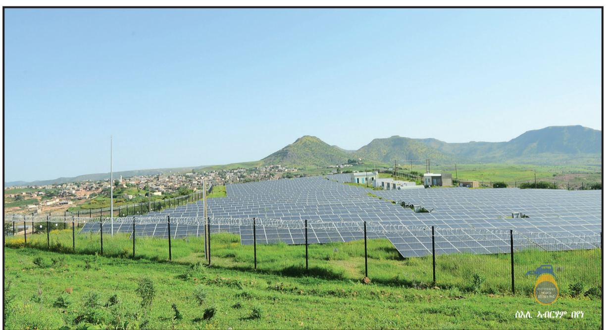
ሰአል አብርሃም በዩኒ