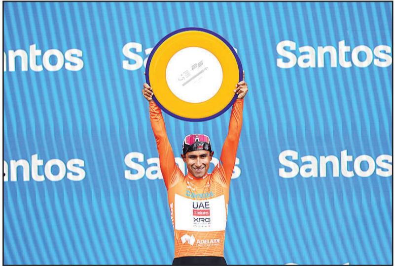
ዕዉትለ ጅግራ ጅናታን ናርሻዘ

እሊ 132.32 ኪሎምትር መሳፈት እተ ለገብአ ጅግራ፡ ወድ አውሰትራልየ ጆስ ኬፕ እብ 3ሳ፡ 09ይ፡47ካ፡ ተዐወተ ዲቡ። እት ፈሪቅ እስታንቡል ናይ ቱርክየ ለልተልሀው ውላድ ፈሪቅ እግል ዴግሮስ ላቶም ኤሽን የማኔ ወናትናኤል ብርሃኔ ደርብ-