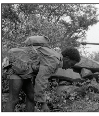
ሕግሰ ወቀርቲ ለህለ ትብብ እንዴ ጸብጠ፡ ድማን ወድገለብ ጽርግዮ እት ህለ እብ ጋድሞታት ህዩ ጋዴን እንዴ ጸብጠ ትመየ።

ዲብ እሊ አምዕል ክፈል-ዳሽ 85 ሳዕት 6:15 እስቡሕ ህጃም እንዴ አምቡተ፡ እብ ድማን ዲብ