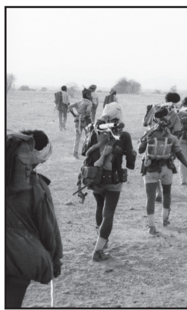
ሻፍፍ ለዐለ እግል ጀብህት እንዴ ሐንቀ ሸት እቡላ ለጸንሐ ናይ አባይ 16ይ ሰንዋቅ መከናይዘድ ብርጌድ ወ29ይ 5ይ ወ3ይ መከናይዘድ ብርጌዳት ገበይ

ዲብ እሊ አምዕል እሊ ክፈል-ዳሽ 70 ምን ትመየ እቱ ባካት ኮርባርዮ እንዴ ተባገሰ፡ እግል ኮርባርዮ እንዴ ሐልፊ እግል ከጥ ደቀምሐሬ ተረእምኒ እንዴ በትኩ እግል ጸጋሮ እንክር ድማን እንዴ አትላ እግል ዐራቶ ወደንገል ለለአትጸብጥ መዋቅል እንዴ ጸብጠ እብ ጀህት ድማን ምስል ክፈል-ዳሽ 16 ትጸብጠ። እብ ጀህት ድገለባይት ጀብህት እሊ ህጃም እሊ ለአተላላ ዲብ ህለ፡ ለዲብ ደቀምሐሬ ወትኩል