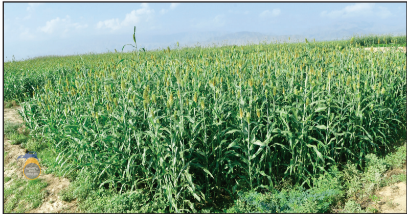
ጥድቅ ምን ግሪህ እክል ሽዕብ