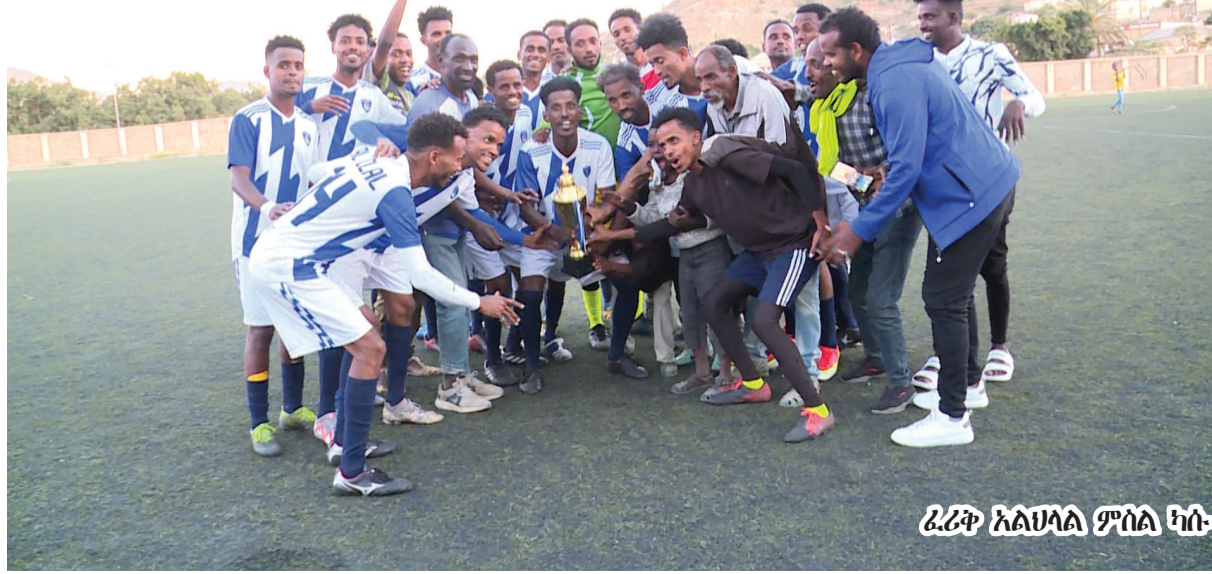
ፈሪቅ አልህላል ምስል ካሱ