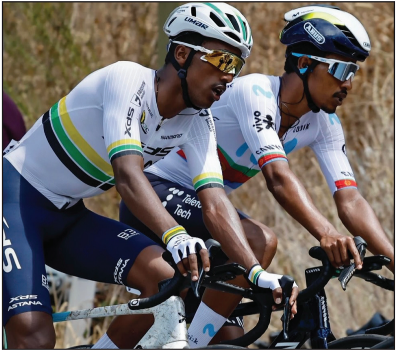
እት ዱር ዳውን አንደር ለሻረከው ሄናክ ወናትናኤል

እግል 25 ኢት እት ዱላት አውሰትራልየ ለገብአ ዱር ሳንቶስ ዳውን አንደር፡ ለሐልፊት ሰንበት ዐባይ ሳድስ መርሐላቱ እንዴ ወደ ተመ።