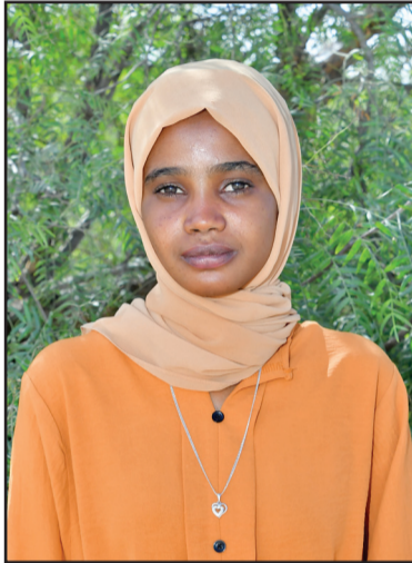
ደረሳይት ፋሞግ ክራር