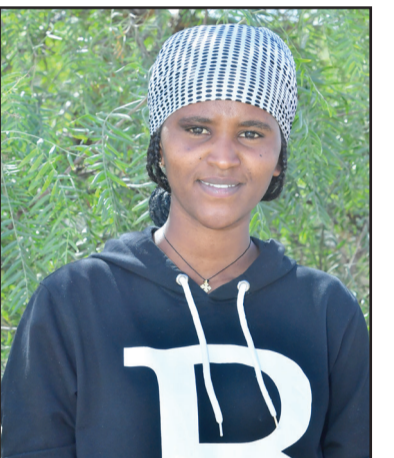
ደረሳይት አርያም ሰመሬ