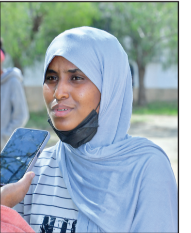
ደረሳይት ርቅዩ ጀማል

መድረሰት እንዴ አምነው፡ ‘ምን ቤትኪ እት ቤትኪቲ ኣብሸሪ’ ምን ቤለወኒ መጽኡት ወክምለ እለ ቤለው መደርሰንን ዝያድ ዋልዳንን እት እንቶም ጸንሐው። እሊ ሆይ እግል እፈድብ ዝያድ መስኡልየት ለአረፈዐኒ” ትብ።