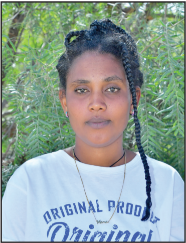
ደረሳይት ርቤል ጃምቦ