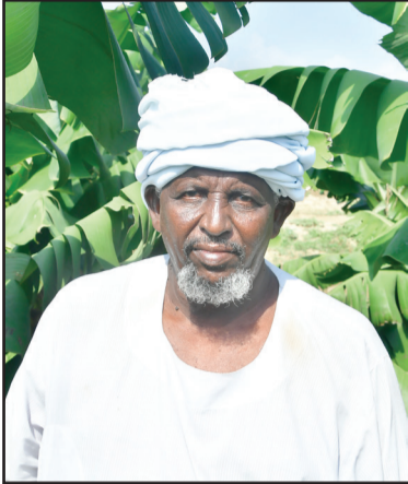
በዐል ጃርዲን እድራስ ግምር

ተመር ቅዋት ድፊዕ፡ ሰኒ ሂሩር ሰበት ህለ፡ አሰይድ እድራስመ ዲቦም እንዴ ጌሰ ተጃርብ ክም ነስእ ምናም፡ እምበልሁመ ምሰለ እት ድዋራቱ ለህለው ሐረሱቶት ተጃርብ ምን ናሰኖሶም ክም ነስእ ወደሐ እግልዩ። ምነ ቅያሰ 20 ሄክታር ለገብእ ምድር ቀሪም እድራስ ግምር፡ ለአግደ እክል ማሸለ እት ገብእ፡ እግል ንዋይ ክም ዐለፍ ወእግል አዳም ህዩ ክም መሳሪፍ ለገብእ ቱ። ሰማን ሄክታር ለትገብእ ገርህት ህዩ እግል ማሸለ ሌጠ ክሰሰ ህለ። አሰይድ እድራስ ምነ ንዋዩ ለረክቡ ሐሊብ እግል ጸዋሁ ሌጠ ድኢትን፡ አሰክ እል ሱግ እቱ ክም ኢልአዘቤ ወዴሕ። ምናተ ግሪ እል ጣሐነት ናይ ፍሩሰክ በህለት ናይ ቃንጨ ወክርድ እንዴ ተወቤ