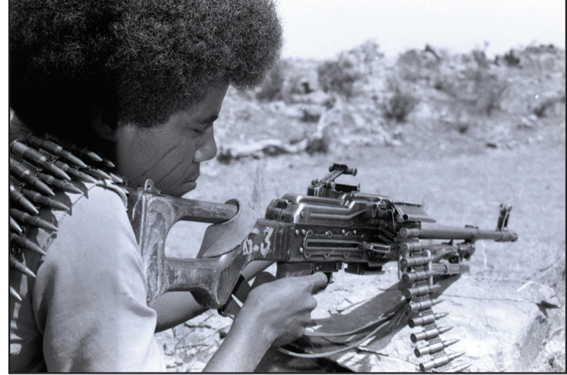
ልትሓራብ ትመየ። እሊ ዲብ ገብአ እብ ጀህት ሰሰሕ ለዐለ ውሕዳት አስክ ቅብለት ምፍጋር ጸሓይ መዋቅል ወቀርቲ ፈግር

አስክ ተረእምኒ ገጸን ትቀደመየ። ምናተ ተረእምኒ እንዴ ኢበጸሐ ዲብላ ህለ ጋድም፡ አባይ 20 ደባባት ውብዙሕ ዳሽ እዳሉይ ሰበት ዐለ፡ እንዴ ትከረዐ ተረእምኒ እንዴ ኢበጸሐ ትመየዮ።