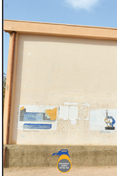
2ይ ደረጃት መድረሰት አፍባቢ

ዐረየት 24 ንቅጠት፡ ናይ ምህር እግል ዐባዩ ህይ 25 መርከዝ ህለዩ። ከምሰልሁመ ናይ ምሴ ለለአደርሰ 5 መድረሰት ህለዩ። እት ክለን እዳራት ደዋሐ ህይ ተዕሊም ቡጻሕ ህላ እምበል። ዲብ እዳረት ደዋሐ ግልቡብ ህታመ ለዐድ ዲብ አሰሶተ ልትከደም ህላ፡ ሐቅሁ ከደማት እጅትማዕየት ለገብእ እሊ እብ አግቡይ እግል ልትሸቄ ዲቡቱ። እሊ መዳርሰ እሊ ለበዝሐ ምኑ እብ ብክ ለትሸቃቱ። እሊ ህይ ካሬ ሰበት ኢኮን፡ እት ገሌ አካናት እብ ሰዐር ለትሸቀ ንዛም መዕደኒታት ህላ እግል። እሊ ህይ፡ ክል ሰነት ሰበት ክርብ፡ አትሳናይ እት ገብእ እቱ ክድመት ለህይብ ህለ። ሰበት እሊ፡ መዳርሰ