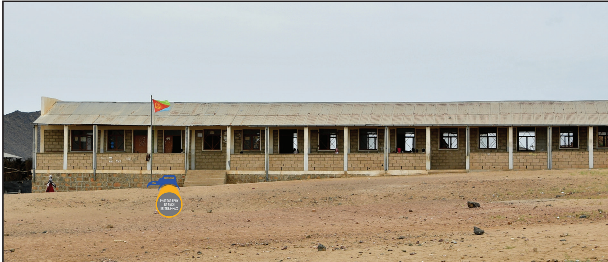
2ይ ደረጃት ሽዕብ

በሊሴ፡ ለመዳርሰ ለብኩያት፡ በዲር እግል ሐ-ዳም ናይ መኣንብታይት ደረጃት ደረሰ ለትበኒያ ተን፡ ከጭብ ናይ ኣፍሱል ወዘረበት ለበን ተን፡ ምስል ወሰት ደረጃት ህዬ፡ እምበል ሐምስ መድረሰት፡ ለብዕዳት ምግባይት ደረጃት ለበን ተን፡ ለበዝሐዩ መዳርሰን፡ እት መደት ቅድምት 1993 ለትበኒየ ሰበት ቱ፡ ብናህን ለኣበራ ቱ፡ ወሰክመ ጋብእ ዲበንመ ኢኮን፡ መሰለን፡ የም ዓመት ምን ናይ ደግም 700 ደረሳይ ውሱካም ህሌን፡ እሊ ወሰክ እሊ፡ ኩለን መዳርሰን ኣሰባሕ ወምሴ እት ክልኣት ውካን ክም ሸቅየ ዋዲህን ህለ፡ ምስል ተዋልል ኣለት ጀው ወሐፋነት እሊ ምድር፡ ደረሰ ኣክል ኣዩ እት ልክህሎ ደርሶ ክም ህለው ልትረኡ፡ እት ገሌ መዳርሰ ህዬ፡ ደለሳታት እንዴ ወሰከዩ ለኣደርሰ ህለየ፡ ለመዳርሰ እብ ሰብ ሐሰመትሉ ትርበት ወሰገር ለዚንጎታቱ ኣበረ፡ ደግም ህዬ ክልኡ መድረሰት ዚንጎህን ዘህፈት ገሌቱ፡ እሊ ክሉ መጋዲዕ ህዬ፡ ኣስክ እሊ ቱመም ኢህለ፡ እትሊ ለሸብ ለትትቀደሩ እንዴ ኣትፋገረ ኣትሳናይ ምንመ ወደ እግልን፡ ለዚንጎ ለቀዳም ኣትሳነው ድኢኮን፡ ዚንጎ ሐዲሰ ኢገብኣ ዲብን፡