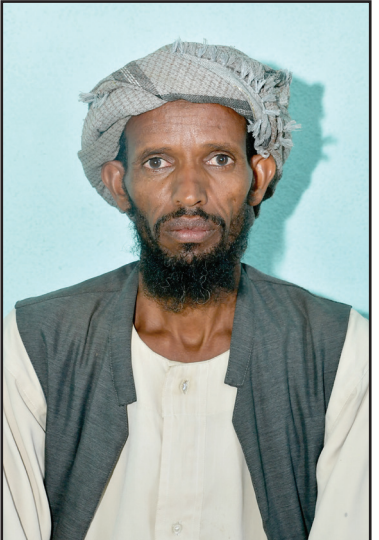
አሰይድ በከፊት እድራሰኛ

እብ ፈርሐ ሕርየት ክሉ ተሐዲ እንደ ተዐዳነ የም ዓመት 33ይት ሰነት ነዐይድ ሀሌነ። እለ ሀይ ክም ኤራትርያን መራር ለሕን ሐለፍን እበ እት እድገቶ ክምሰልሀ ሀሌት እግል ልትብሀል አልትቀደር። እማትን ወአብቸን እብ ደባባት ትክደው። ዐድን ነድ ሓይሳታትን ትቃተለው ወእማትን ተሓረደየ። እለ ጸለም ተእሪክ ዕድዋን እትረአሰነ ለአጅረው ለኢልአምር አሀሌ። እለ መሪር እለቱ ሀይ እግል ሸዑብ ኤራትርያ ክም ሰኪን እንደ ሳሕላይ እት ንዳሉ