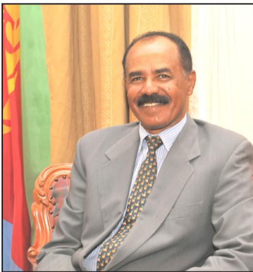
ሪጅድ መሐመድ አልሰላሚ፣ ፕረዚደንት ምክርቤት ስርዓት ለማግኘት ታደላንድ ስራዎችን ለማረጋገጥ ደግ

መራሕተ የመን ምክርቤት ታደላንድ፣ ብሔራዊ መግቢያ 33 ዓመት በዓል ናጽነት፣ ናብ ህዝብን መግቢያን አርጎራ ናይ የሆነ መልእክት ሰጪዎ። አራመገር ባይቶ ፕረዚደንታዊ መሪነት የመን ዶ/ር ሪጅድ መሐመድ አልሰላሚ፣ ፕረዚደንት ምክርቤት ስርዓት ለማግኘት ታደላንድ ስራዎችን ታሰቢን ብሎ መግቢያውን ሃረግ ለመስጠት ስራዎችን መልእክት ፕረዚደንት አሰይዖስ አፈወርቂ ምስክር ወይን ናይ ስራዎች አሰሪዎችን ማረጋገጥ ደግ