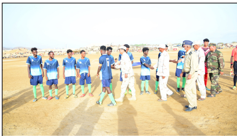
ወይኒ ዝበረረወ ኣብ ኣልገን ብልጽጎት ኣመዘገቡት ሹቶ ኮይኖ።

ዝኣተወ ተዳውት ብደሆ፡ ሚያን ጸውታ እኳ እንተተቐጻጸር ምክልኻም ግን ኣይካላለኹ፡ ድሕሪ ዝደከ ፊት ግን ኣብ ስራት ዘደገቡም ሹቶ ኣመዘገቡም፡ በዚ ሹቶ ጋታ ዓጺ ርዓን ኣብ ልዕሊ ብደሆ ዓውት ብምዃር ምዃርን ቅኝ ሰፖርት እዚ ተወርቆ ሓይሊ 2024 ክነትወን ብደቁ፡ ብደቁ ደቂ ኣጸላጎ ኮኻ ጋታ ኣልገን ኣብ መካከል ጸብላል ብምዃል ኣፍላል ምዃርን 2024 ደገገ፡ ቃና መልካታ ኣብ ጋታ መደሕን ብፀ ሹቶታት ብሉጽ ኣመዘገቡ ሹቶ ክርጸኡ እንኩ፡ 12 ሹቶታት ብምዃር ደማ