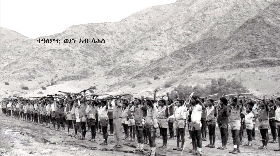
ተዓለምቲ ወያነ ኣብ ሳሕል

ብዚጋታት ጸላም ኣብ ኤርትራ ዝተኸደ መጽናዕቲ ከምዘመልከቶ፡ ክብሎም ወያነ ብዘኸደ ክብ ዝተፈለገ ክበታት ኢትዮጵያ ዘበረም ልዕሊ 75,000 ኤርትራውያን 7% ኣብቲ ወያነ ክብ 1991 ክሰብ 1993 ስልጣን ገምገማ “ሰላማ መረጋጋት” ብዘበል ስም ዝኸደ ናይ ጸቕታ ሓይሎ ብራት ዝኸደን ገምገማ ናይቲ ስርዓት ብዘበርም ኣበርክቶ ናይ ምሃዳን ወጻኦት ዝተቐበሉን እዮም ነይሮም፡ እቲ መጽናዕቲ ብተወሰኹ 6.8% ናይ ፓርቲ (ኣብ ወደባት ኣላወደን) ኣባልነት ዝበርም 19.6% ገደብ ብምውጻእ ነቲ ፓርቲ ዝደግ-ዝበኡ 45.2% ደግሞ ኣብ ግዜ ምርጫ ገደብ ደግሞ ኣሎት ብዘይኡ ቅንጽን ስራሕን ምዃርቶ፡ ሞልቶን ክሕደትን ግን ባርራ መራሕቲ ወያነ እዩ፡ ብዓል ጸብቐ ዝበል ሕልና የለ፡