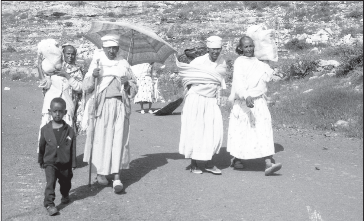
ስርዓት ወያነ ሰለይቲ ኢሉ ብግፍ፡ ክብ ዘባረሮም ዜጋታት

ኣሎት ክብሎም ገደብ እዮን ብዘኸሩ ኣብ ኢትዮጵያ ዝቐመጡ ገበያ ኤርትራውያን ኤርትራዊ መዘገብ ዘለም ኢትዮጵያውያን