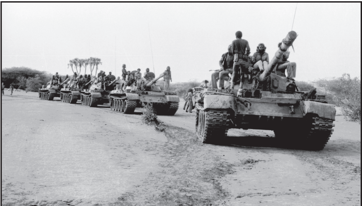
ግምገማት ሰነራተጃዳዊ ምዃራን - ህዝቡ ሰነራተጃዳዊ ጉልበት ተኸፊተ ዘበርኽ ብዙሕ ኣጸዋር ሰሊሎ ዝዓጠቐሉ እዞን

ኮኸብ ኣጠላ፡ አብዚ ወራርባ ደርግ ብኣርባባኡ ግንባራት (ናቕፋ፡ ሰነራተጃዳዊ ምዕራባውያን ሳኒል፡ ባርነን ተልታልን) ልዕሊ 120,000 ሃይሕ ታሰላምን ልምምድን ዘድድ ዝህል ደገፍ ናይ ከባይቲ ኣጸዋር ነፍሲቲ ወግዶን ሃላፊታትን ዝህል ሰነራተጃዳዊ ኣሰራፍ ብርታዕ መዋቃዕቲ ልኡ፡ ድኸን ምር ድሕሪ ናይ ኣሰታት ኣርባባት ኣዋርሕ መረር ምርብራብ ሻዳሻይ ወራር እውን ብሓይል መኸተ ህዝቡ ሰነራተጃዳዊ መኸተ ተረፊ። አብዚ ከባድ ምርብራብ ዝተኻየደሉ ወራርባ፡ ጸላኢ ልዕሊ 55,000 ሰነራተጃዳዊ ክሰራ (ምዕታትን ወገኣትን ምርኻብን) ተሰኪሞ፡ ህዝቡ ሰነራተጃዳዊ ልዕሊ 10,000 ብዘይደቡ ኣጸዋር ካብ ሰነራተጃዳዊ ጸላኢ ክሰራብ ኣጸብሎ፡ ሰነራተጃዳዊ ነፍሲቲ ከፍተኛ ሓይል ሃላፊ ኣሰታት 30 ታንክታትን ኣሰታት 90 ወተሃደራዊ መካይንን ተዋገኸሉ አብ ልዕሊ ጸላኢ ከባድ ምታዊ ክሰራ ኣውራድ። አብዚ ልዑል ጀግንታዊ ኤርትራውያን ዝተመኸረሉ መረር ወግዶታት ካብቲ ምን ነቲ ወራር ዝመኸቲ 13,000 ዝኸት ተጋደላቲ ኣሰታት 2700 ክሰራ ኣጸብሎ፡ ኣሰታት 5000 ኮኔ ከባድን ልኡሰን መውጋቲ፡ ኣጋጠሞም። ልዕሊ ፍርቂ ካብ ዓቕሚ ህዝቡ ሰነራተጃዳዊ ሰውራትን ወገኣትን ምዃራን መርኣዮ ምረት ናይቲ ከፍተኛ ጸንጎት ተጋዳሪን እዩ።