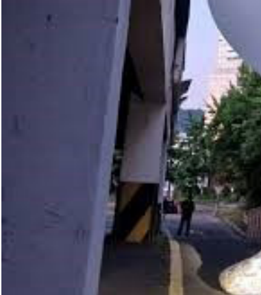
መገንዘብ፡ ደቡብ ኮርያ፡ ነቲ ኣብ 2018 ምስ ሰሜን ኮርያ ዝተኸተመ ወተሃደራዊ ስምምዕ ክምዕደሎም ኣዳሊጡ።

ብጻላይ ኣብዚ ቅንያት፡ ደቡብ ኮርያ ብዘገባሉት ሰሜን ኮርያ ተቐጠዓ ምዃን ጸብዓቲ ይጠቐሱ።