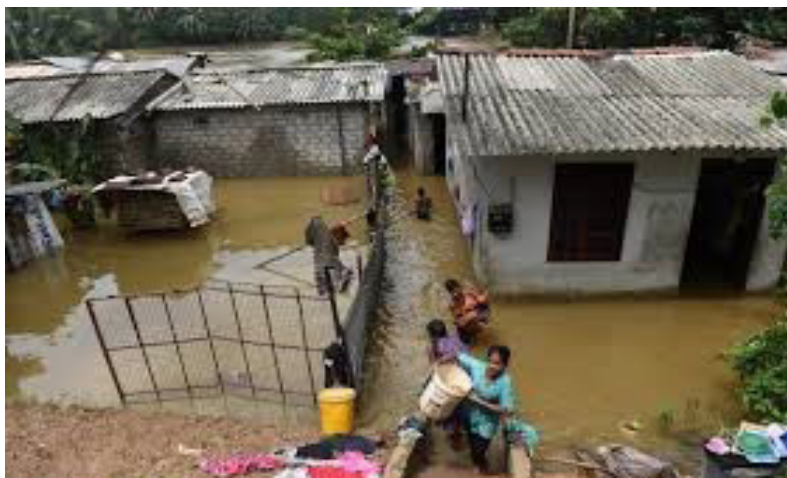
ሆንዲ - ብብርቱቅ መቐት 85 ሰባት ሞይቶም

ተኸተሉ ክምዕደሎም፡ ኣብ ብርቱቅ ዝኖብ ብዘወገኑ፡ ኣብ መገንዘብ ምዃን ኣደጋን ኣውን ከበድ ሕጽባ ክምዕደሎም ኣደጋ።