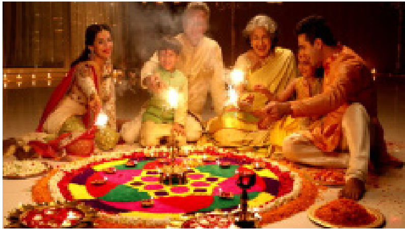
ንምጽግል ብኣሕዳት ዝቐጸሩ ሰባት ክብ ወጻኢ ሃገር ናብ ህንዲ ደውብዮ። እዚ ፊትገሳ ዝኾሎ ሰባት ኣብ ናይ ሂንዲ ኣገጽ ዝተመርጸ እዩ።

ፊትገሳ ዲቦሊ ምስ ኢዮን ተተካካይ ዝኾነ ፊትገሳ ኮይኑ ልዕሊ በልዮን ዝኾነ ሰብ ዝገምብልዎን ዝበዘመን እዩ። እዚ ንሓምብት መጻጻፊት ዝቐጸል ፊትገሳ፡ ብርጅት ወለዕኻ ንሓሊ ብምሳዕድ፡ ብጸላት፡ ገጽገጽ ብምርጻፍ ምስ ስድራ ቤትካ ግዜ ብምስላፍን እዩ ዝኾነ።