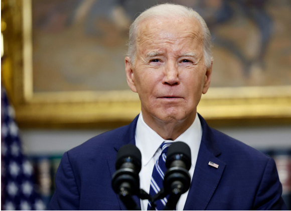
ባይደን “ኣን ሕጻይ ሰልፊ ደግሞራትን እዩ። ካብዚ ከውጽኢ ገናኻል የለን” ክበል ነቲ ገደብ ዘሎ መጽዋዕታታት

እቲ ምክትል ክትትኡ ትክክል እየ ተሃሊ- ክገብሩ ገደኑኦ - ምክትል ካላ ሃላን ሃላን እውን ንውሳኔ እቲ ፕረዚዳንት ዘለዎ ደገፍ ኣሎ።