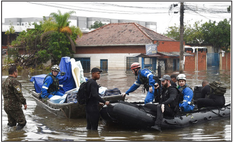
ተረኻ ፋርማሲ ፋርማሲ ኣጋምፎር ዕለት 5/7/24 ጎደና ሓርካት ቁ.158፡ ፊት ሲም ኣጋምፎር ቁ.ቴሌፎን 127565

እየም ተመራመርቲ ሓይሽ ሳይንሳዊ ኣገደ ብምቕጻም ዝተሓተ ዕድሜ ናይቲ ኣብ በዓቲ ደሴት ሰላጭን ዝተረኸበ ሰኢ ክፈልጡ ከምዘክኡ እየም ዝከብሩ።