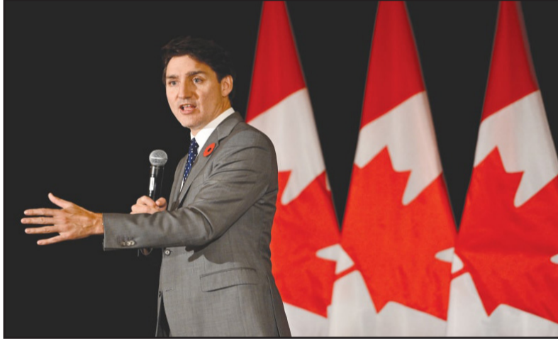
ጎሩሩ ጃስቲን፣ ቅድሚቲ ዝመጽእ ርክብ ዝድረ ሃሪቂ ኣኸባ ባይቶ ክኸውን ከምዘኸኸል ምንጨታት ኣረጋገጸ።

ቀዳማይ ሚኒስትር ካናዳ ጃስቲን ጎሩሩ ካብ ስልጣኑ ብፍቓድ ክወርድ ምዃኑ ዝገልጽ ሓቢራ ከውጽኦ ከምዘኸኸል ምስቲ ቀዳማይ ሚኒስትር ቅርብ ዘለዎም ምንጨታት ገለጸ። ይኸንግምሮ ምልላቅ ካብ መዝክቲ ናይዚ ክኸኸሉ ምዃኑ ከም ቀዳማይ ሚኒስትር ካናዳ ኮይኑ ዝገልጸሉ ብሉጽ ስልጣን ናይ መውጫታ ስምምነት ክኸበ ዘይተወሰደ ኣብ ግዜ ክውዕል ደዩ ኣይከውዕልን ፍሉጥ ኣይኣብኡ። እቲ ምንጨታት ንጋዜጣ ማሎብ ኤንድ ሚደል’ ኣብ ዝሓዘዎ ሓቢራት ጎሩሩ መላእ መዝክቲ ክለቅቅ መደብ ከምዘሎ ብልህነት ከምዘረጋገጡኦ