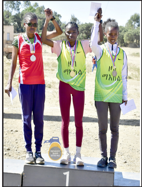
ዕወታት ማርያ፡ ቅዱሳን ኣርያምን

* ኣብ ዝተገለጹ ግድዳ እናገለጹት ትመዳዕ ዘለ ክከብ ደንደን ኣብዚ ውድድር ኣይግድን። ወላኤ ኣብ ግዜ ደቂ ተገባሮች ስድስተኛ ምዕመል ስፖርት ብደቂ ተገባሮች ነይሩ ኣይገለጹን። ምን ኣብ ግዜ ደቂ ኣገሳታዊ ብደቂ ስፖርት ዘምዱ ወርቅ እኩሎ ክከብኩ ኣይከኣሉን። ብኣገሳታዊ እዚ ውድድር ኣብ መገን