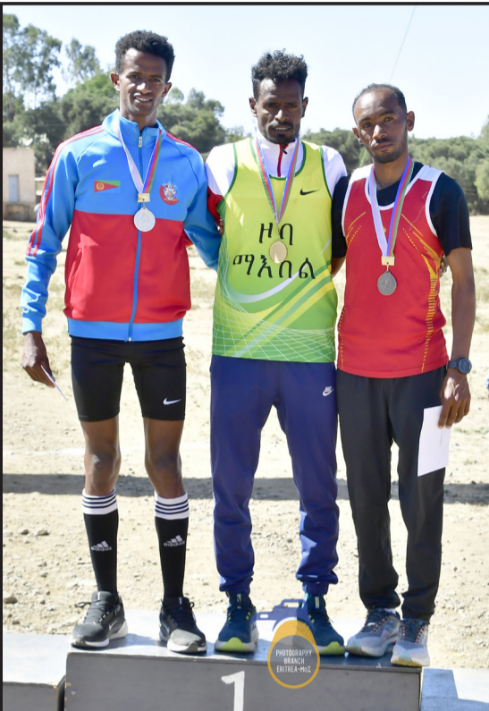
ዕወታት ኣርገ፡ በረኽትን ሰመረን