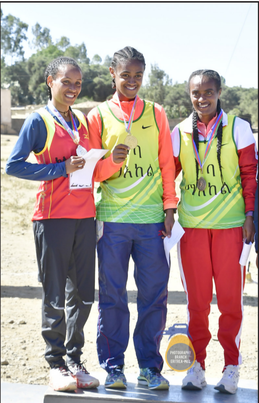
ዕወታት ራሃል፡ ርግብን ዘቡብን

መንደራ ክብሩ ጸዮ ኣካል ተክይዳ። ኣብዚ ውድድር ዘባታ ደቡብ ማእከልን ግንባርን ኮሎኒውን ማእከል ምልክት ክከብ ደንደን ገለ ናይ ወልቂ ኣገሳታዊ ተወዳዳሪ። ኣብዚ ሓገሪ ዘርፍ ክልተ ከለሞዘር