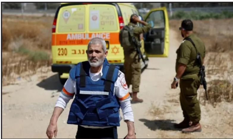
ሓምሰ ብሕጂ ክኸገር ዝክኸል ዝኸነ ይኸነ ስምም እውን ናብ ምዃሎ እቲ ኩናት ዝመርኦ ምዃኑ መረጋገጹ።

ሓምሰ ዝሎ እምመ ብጭታ ከምዘርጸዩ እኳ እንተኣይኦ እቲ ቀንዲ ኣካራኒ ኮይኑ ዘሎ ነጻቤ እቲ ተክሲ ደው ናይ ምዃል እዩም - ቀምሚ ደዩ ማይዊ ክኸውን ዝበል ምንቲ ከምዃሎ የገንዘቡ።