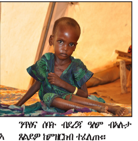
ገሃዮና ሰብ-ብይረጃ ዓለም ብኣላታ ጸልዎ ኮምዘርከብ ተፈለጠ።

ኮይ ደቂ-ተሳባቲ ካብ ኣመጋገባም እኸል ዓቕን ካልሲያም ናሲን፡ ታሞን፡ ዘይኮይ ማግዘይም፡ ሻይታሚን ኤይ፡ ሻይታሚን ሲን ደረኽቡ ኮምዘለዉ ተሳባቲ። ቀንዲ ምክንያታት ናይዚ ኣብ ኣሲዮ ሓወሲ (ህራ ኣፍሪቃ ሰሜን ኣመሪካ ኣውሮጳን ዘርሃም ዘሎ ዋሕዲ ማዕድናት ኣብ ኣላት፡ ሕጽረት ቀረብ መጠን፡ ምህንኻ ዝተመርከቡ መዳዘታትን ጉድለት ኣፍልጦን ምዃናዮ ዝገለጹ። እዚ ኮኣ