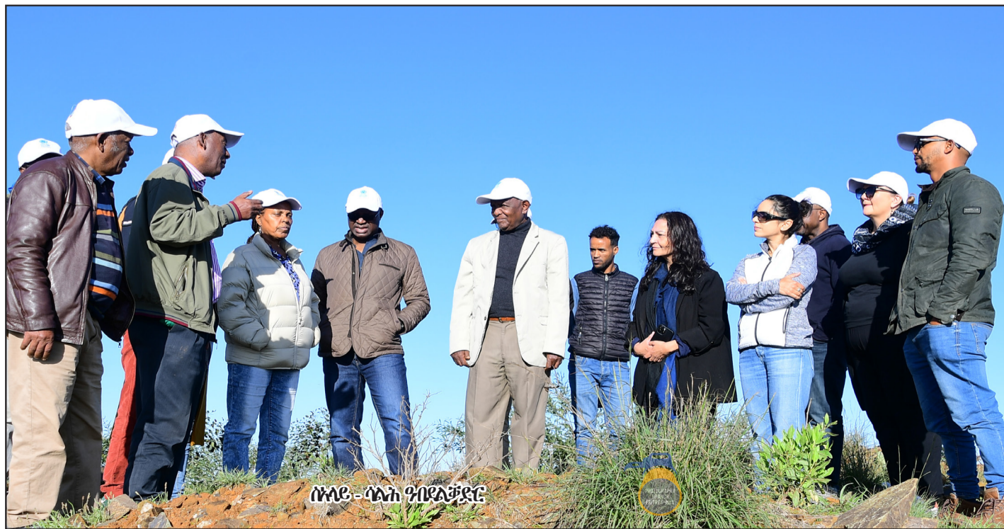
ሰላሳ - ሰላሳ ዓብይዳሙ

አብ ደረጃ ምዃን ዝኸኸሉ 500 ሺሕ ልሳታትን ካብ ዝተገበዙሉ ዝተከሰሩ መደባት ከምዃን ብሰጪት ብሰጪት መደብ ተገሪቡ።