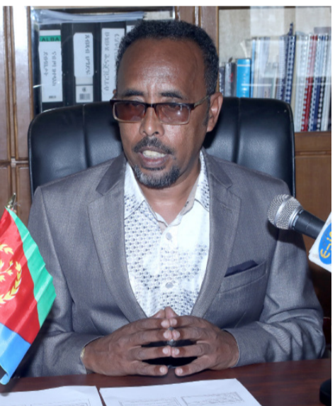
መዘነቲ ኣብይተ-ትምህርቲ ኣብ ሸርጌ፡ ዓዲ-ዝጽፎ ላማን ትኩልኔ ብጠቐላ 74 ትሓት ትምህርቲ ኣለዎ።

ክጸልዎ ምዃን ኣብ ካልኣይ ስምዖን ዕይብ ምክትታል ብምዃር ናብቲ ዝደሊ ብቐዓት ጎምሕያል ክከራ-ከሎ ምዃን ኣብህፊ። ኣብዚ ዓመት ያህ ዝበከኩ ተመሳሪ ኣብ ካልኣይ ናይ መዳታን ማክሕልን ደረጃ ኣብይተ- ትምህርቲ ስፍራታትን እርጋንን መጽሓፍቲ ኮሚቴ ብምሕደር ደማ ኣብ እዋን ክረምቲ መጽሓፍቲ ጎምሕያል ዝቐድ ጎምራታት ብኮከብ ኮሚቴ-ባዕሪ ኣረጸኡ። ኣብ ንኣሰ ዘባ ጋላ-ክፍሒ፡ 37 ኮምወን ስፍራን መወዳሊ ህጻናት፡ 21 ናይ መዳታ፡ 9 ናይ ማክሕል፡ 3 ደማ ናይ ካልኣይ ደረጃ፡ ኮሚቴ-ወን 4