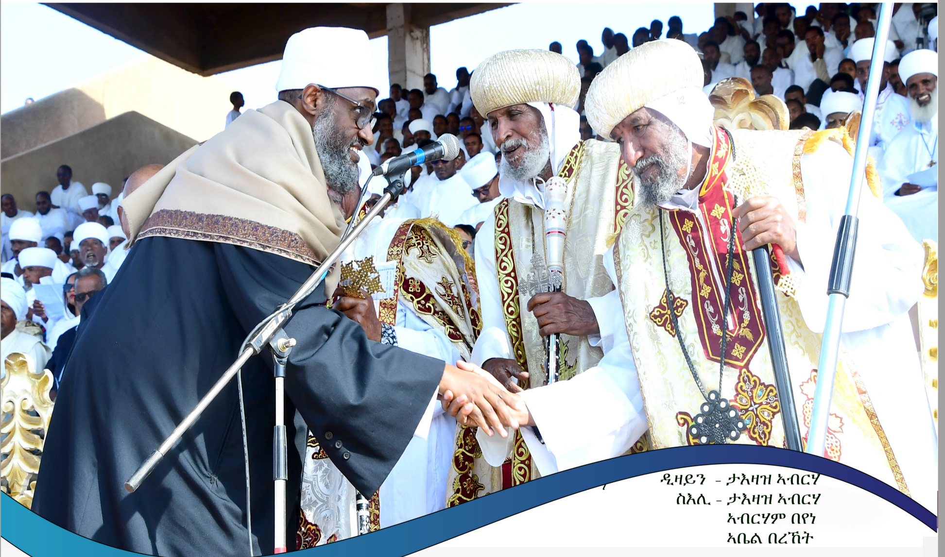
ዲዛይን - ታእዛዝ ኣብርሃ ስኢሊ - ታእዛዝ ኣብርሃ ኣብርሃም በዩን ኣቤል ባረኽት