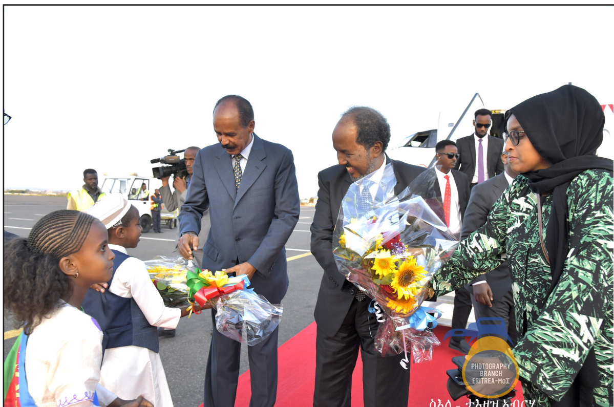
ሰላሊ - ታላላቅ አብርሃም