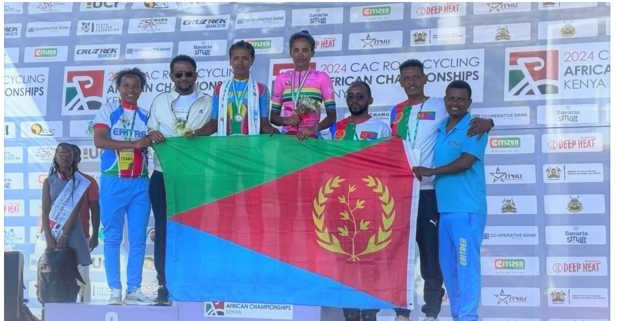
ኣባላት ሃገራዊት ጋንታ ምስ ስድስት ሰለስን ኣድድምን

ኣገደ! ብዚ ኮይኑ ብኩ ኣብ 23 ሃገራት ይካተሩ ከምዃን ዝገገሩ ወድድር ጥምራን ኣፍሪቃ ኤርትራ ሞሪኦን ሓይሊን ብዘርኽ ዓመት ክጸኣ ኣሎ። ምስ ደቡብ