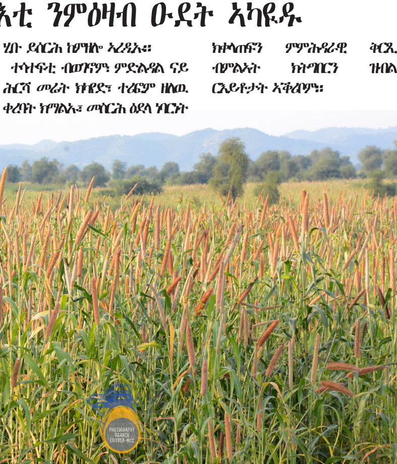
ሰላሊ - አክሊሉ ዘርአገቢ

ደቡብ ወይን ለሥራዎች ሪፖርት ስለሚሰጡ ሰውነት ለማስጠበቅ የሚያስፈልጉት ጭንቀት ምን ዓይነት ነው? ለሥራዎች ሪፖርት ስለሚሰጡ ሰውነት ለማስጠበቅ የሚያስፈልጉት ጭንቀት ምን ዓይነት ነው? ለሥራዎች ሪፖርት ስለሚሰጡ ሰውነት ለማስጠበቅ የሚያስፈልጉት ጭንቀት ምን ዓይነት ነው?