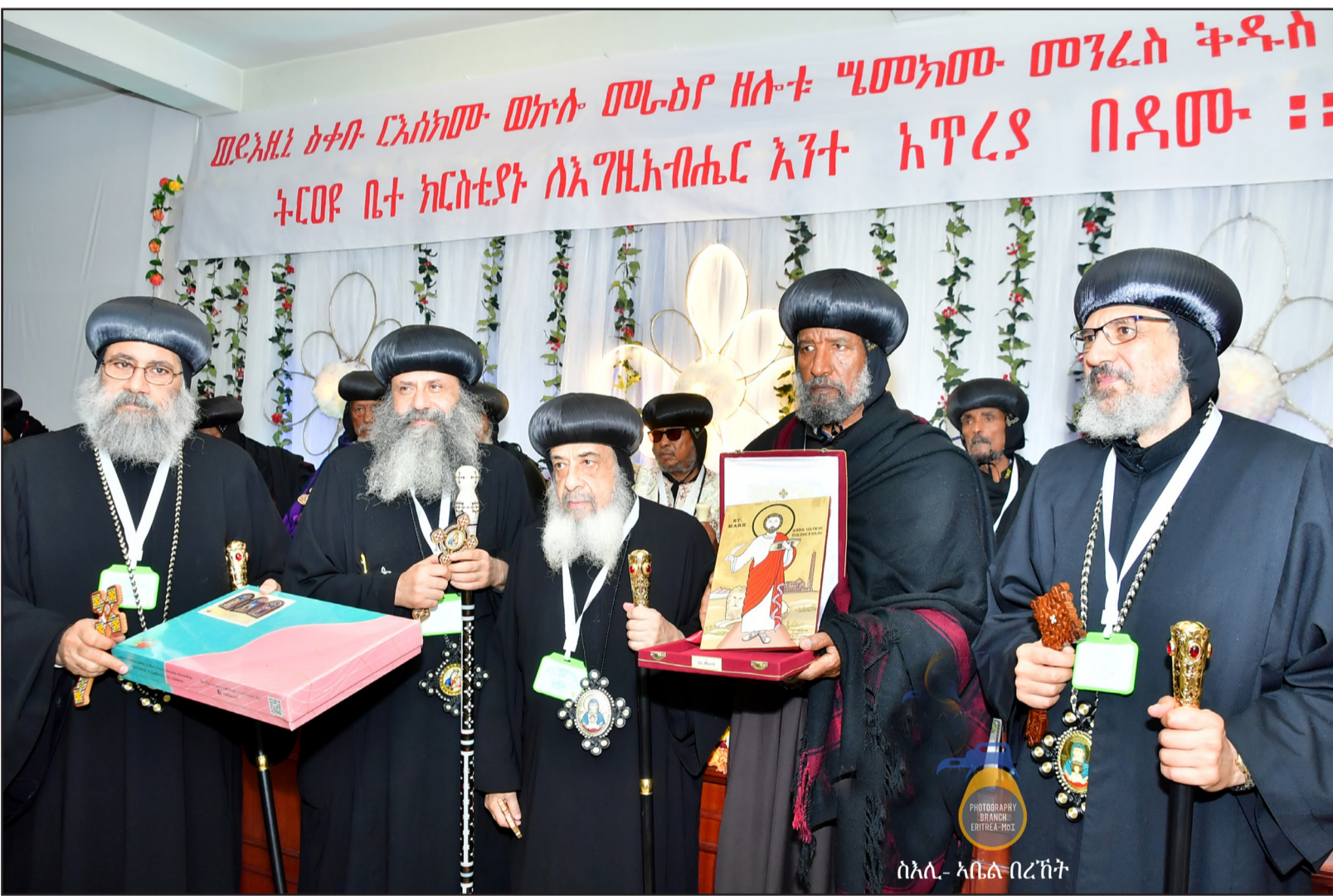
ባህሉ ስም ምጽጻብ ገለጸም። ብሉይ ለቀ ጳጳስ ኣብ ፓትርያርክ ኦርቶዶክስ ተቃራኒ ቤተ-ክርስቲያን ኤርትራ - ለቀ ጳጳስ አብ ባህሉ 26 ሞይ 2025 ንክብሩ ድምር ተቃራኒ ኣሎ። ብሉይ ወቅዱስ አብ ቁርባን ቀምጦ 5ይ ፓትርያርክ ወርሰ ለቃ ጳጳስ ኦርቶዶክስ ተቃራኒ ቤተ-ክርስቲያን ኤርትራ፡ ብገ 2022 አብ መዘገብ 96 ዓመት ዕድመ ስምምነት ከምኡ ኣሎ።

ዋና አመካከሪ መግቢያ ፓትርያርክ ኦርቶዶክስ ተቃራኒ ቤተ-ክርስቲያን ኤርትራ ከብሉይ ተመሪያም ከገለገሉ ገደብ ለቀ ጳጳስ ብሉይ አዲስ ባህሉ ስም 9 ታሕሳስ አብ ኦሪገናል መግቢያ ፓትርያርክ ኦርቶዶክስ ተቃራኒ ቤተ-ክርስቲያን ኤርትራ ከብሉይ ተመሪያም ተመሪያም። እቲ አባቶ ቅዱስ ሲያዳሱ ወክልቲ ገምገሞ ኤርትራ፡ ገባኤ ለቃውንቲ ሃገረ ሰብረተው ወክሎ ሃገርን ወጃን ከምኡውን ወክልቲ መገሰላዊ ኮሌጅ ዝተሰየመ ምርጫ ብመሰረት ውሳኔ ቅዱስ ሲያዳሱ ወምቶ ሕገምርጫ ቅድስቲ ቤተ-ክርስቲያንን ተካላ። አብ ገደብ ስራርጎ፡ ወክል ቅዱስ ሲያዳሱ - ለቀ ጳጳስ አብ ሃውሃን ድሕሪ ዘምህዞ ወምቶ መኻፊቲ ቃሉ ብመሰረት አብ መገን ኣካት ኣብ ቤተ-ክርስቲያን ኦርቶዶክስ ተቃራኒ ኤርትራን ግዘን ብሎ ፕሮቶላዊ ስምምነት ከም ተግባሩ ዝገዛዮሉ ልኡኽ ቅዱስ ሲያዳሱ ግዘጹ ዝመርኮ ለቀ ጳጳስ ኣካል ከምኡውን ወክል ቤተ-ክርስቲያን ሃይማኖታዊ ጉዳይቶ ኣቶ ኣምኡኣል ተከላኪሎ መደረ ኣሰገዘም። ቅዱስ ሲያዳሱ ነቲ ወጽኢት ምርጫ ድሕሪ ምጽጻብ፡ ብሉይ ለቀ ጳጳስ አብ ሳይንት አብ ዝተሰየመ መዘዋወሪ ቃሉ መሰረት ምርጫ ብሉይ ለቀ ጳጳስ ከምኡውን ገገራ ፓትርያርክ - ለቀ ጳጳስ ብሉይ አዲስ ባህሉ ስም ምጽጻብ ገለጸም።