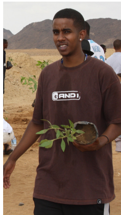
ጉሓፍ'ዩ ዝብል ዓርኪ ኣሎኒ፡፡

ኣዲና እንታይ ንግበረላ? ገጸ ከይፈርስ ንወልወላዎ! መሬትን ኣብኣ ዘሎ ኩሉን እቲ ዝበለጸ ህያብ ተፈጥሮ'ዩ፡፡ ተፈጥሮ ዕለት ዕለት ማእልያ ዘይብሉ ጽባቕ ትቐርበልና'ዩ፡፡ ካብ ጽቡቕ ዕንባባን ሃገግታ ሞዑም ጨናን ክሳብ ጩቕጩቕታ ኣዕዋፍ ዝዝርጋሕ ዘይነቐልበሉን ከም ትሑዝ ንወስደን ጸጋታት ካብ ለጋስ ኢድ ተፈጥሮ ንረኽብ፡፡ ገለና ንጸባቕ ተፈጥሮ ጽባቕ ክንውሰኽ ንሃልኹ፡ ገለና ከአ ዕለት ዕለት ፋሰን ምሳርን ሒዝና ተፈጥሮ ንዝተኸሎ ጽባቕ ንጉንድብን ነባድምን፡፡ ገለና ከአ ጉሓፍና ፈቐዶኡ እናደርበና ኣከባቢና ነጋዕዚ፡ ካልእሲ ይትርፈ ማሰቲካን ናይ ኣውቶቡስ ትኩትን ኣብ ጸርግያ ዘይድርብዩ ጽፋፋት መንገዳችን ከአ ኣለዉ፡፡ ንጉሓፍ ኣብ ዘይቦታኡ ዝተሕፍ ንግዕሉ