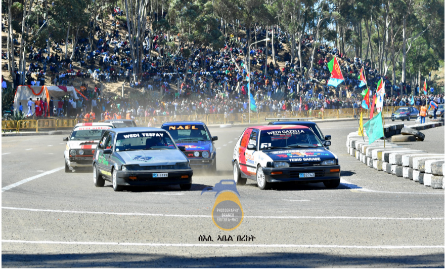
ሰላ - አባል ባረቢር

ግንደቤት መውሰድ ይጀምራል። አባል ባረቢር ሕይወት ለመጀመሩ ለሚጠበቅ ሁኔታ ለመፍጠር ስለሚችል ሞተር ስፖርት ማህበራዊ ጉዞ ለመሰማራት ለተጠቃሚው የሚታዩት ሁለት ግራንድ ትራንቲቶ አካባቢ ነው።