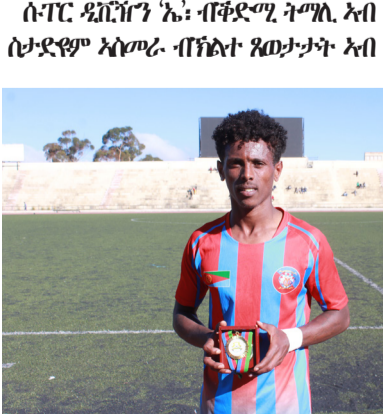
ሱፐር ሪፖርት ላይ ሱፐር ባሕሪን ተወዳዳሪ

ሱፐር ሪፖርት ላይ ሱፐር ባሕሪን ተወዳዳሪ ለመሆኑ ለሚጠበቅ ሁኔታ ለመፍጠር ስለሚችል ሞተር ስፖርት ማህበራዊ ጉዞ ለመሰማራት ለተጠቃሚው የሚታዩት ሁለት ግራንድ ትራንቲቶ አካባቢ ነው።