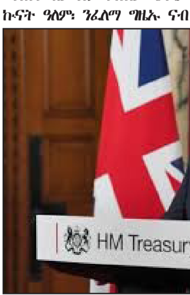
ቁጠባ ብራግንያ ድሕሪ ካልኣይ ኩናት ዓለም፡ ንፊሊግ ማይኦ ናብ ሪቶል ሪብስ ሓበራ። ኣብ ዝኣሉ 14 ዓመታት፡ ኣብ ብራግንያ እቲ ዝኸፍአ ቁጠባዊ ቅልውላው ከምኣተኸሰተ ዝጠቐሰት ቻንሳር ሪቶል ሪብስ ከላም እየም ኣቆጸሞም ንምዃን ብራግንያ ክመርሖ ዝጸንሖ ሰብ-መዘ - ንቁጠባ እታ ሃገር ከምዘገብዎም ወቐሎ። ፖሊሲታት ፖለቲካዊ ሰልፊ - ቶሪኦ ኣብ 2023 ኣብ ዓመታዊ ኣታዊታት ሞቢሪ መምህርቲ ኣሲያት 74 ቢልዮን ዶላር ክራታ ከምዘውረደ - ሪቶል ሪብስ ብተወሃኸ ዝለጸ። እቲ ዝተኸሰረ መጠን ገዝብቲ ገዝባዊ ኣገልግሎታት፡ ኣብደተ-

ትምህርቲ ህሰፎታትን ጉምሃይ ክበራብር ዝኸኸል ዝገፍ ባጀት ምንጻፍ እታ ቻንሳር ኣገዝባ። ብመሰረት ጸብጻብ መጽሓፍ 'ዘ ጋርድያን' - ቁጠባ ብራግንያ ብሰንኪ ተላባዲ ሕምም ኮቪድ-19 ናይ መግብር ቅልውላዎት፡ ኣብ ብራግንያ ብዘተኸሰተ ዘይምርግጋእ ተወሲኹም፡ ኣብዚ ሕጃ እዞን ኣብ ዝደኸመ ደረጃ ቦሊኩ ኣሎ። ኣህጉራዊ ማዕኸን ገዝብቲ ኣብዛ ዓመት እዚኡ ጃምላ ሃሪው-እየት ብራግንያ ብ0.5 ሚሊታዊት ሞሪሕ ዕቡዩት ከርኢ ምዃን ኣሚቲ ኣሎ።