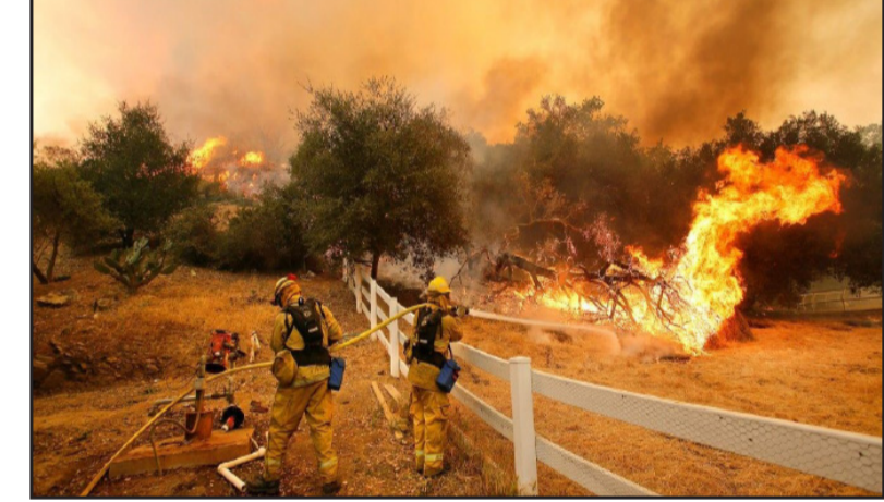
የኩ ከምዘሎ ዝተብዱ ክኣሉታት ምቕጻራ ናይ ከሰን ሃሪውት ሓፍነት ምዃን ኣመልኪቶም። ቦቲ ኣብ ካሊፎርኒያ ኣብዛ ዓመት እዚኡ ክብ ዘጋጠሙ ሓይጋታት ባርዕ ጫይ እቲ ዝዞዶ ምዃን ዝገለሉ ዘሎ ሓይጋ ሃሪውት ልዕሊ 15,600 ጃታር መሪኦት ከምዘዞይመ እዩ ዝሕበር።

ኣብ ክፍሊ-ሃገር ካሊፎርኒያ ሕብረት መምህታት ኣመጽኦ ኣብ ዝኣሉ ሃርት ዓመታት፡ ብሰንኪ ብርቱዕ መቐት ልዕሊ 460 ሰባት ከምዘሞቱ፡ ልዕሊ 7.7 ቢልዮን ዶላር ዝገመት ቁጠባዊ ክራታት ከምዘወረደን - ኣብታ ሃገር ዝተገበረ ሓይሻ መጽናዕቲ ኣረገ። ብመሰረት እቲ ሓይሻ መጽናዕቲ ኣብ 2022 ኣብ ካሊፎርኒያ ብዘተኸሰተ ብርቱዕ መቐት፡ ብውሕዱ 200 ሰባት ክሞቱ እንዘለዉ፡ ልዕሊ 2.2 ቢልዮን ዶላር ዝገመት ቁጠባዊ ክራታ ወረደ። ብሰንኪ ማዕላዊ ሞኒ ኣብታ ክፍሊ-ሃገር ኣብዘን ቀሪብ መግልታት ሞሪኦ፡ ልዕሊ 5000 ሰባት ኣብ ህሰፎታት ክሕብሉ እንዘለዉ፡ ካልኦት ልዕሊ 10 ሺክ ናብ ህጽጽ ረድኣት ከምኣተኛኦ ጸብጻብ የረድኡ። ኣብ ካሊፎርኒያ ዝተኸሰተ ባርዕ ጫይ ኣብ ሰፊኡ ክበታት እታ ክፍሊ-ሃገር ናይ ኣሕዛኸን ብልገንን ናይ ትሕተ-ቅርጽ ዕንደንን ከምዘሞቱ ሰፊኡ ናይ ሕርሻ መሪኦት ከምዘቃጸሉ ልዕሊ 210 ሚልዮን ዶላር ዝገመት ክራታት ከምዘወረደ - እየም ጸብጻብ ብተወሃኸ ዝገልጹ። ኣብዚ ሕጃ እዞን ኣብ ሰፊኡ ክበታት ምዃን ተኸሲቲ ዘሎ ማዕላዊ ሞኒ ንሃገር ደቁሰቲ ቁጠባን ትሕተ-ቅርጽታትን ሃሪውት