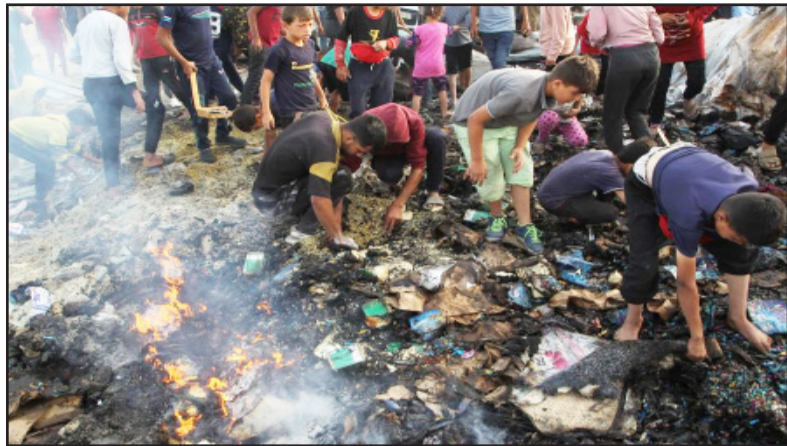
“እስራኤል፡ አብ ወሽመጥ ቃዛ ንዘሉ እየም ሰብ-መዘ. ሚኒስትሪ ሞይቶ ወሽመጥ ቃዛ ዝ. ዳኤሪዋይ

እስራኤል፡ አብ “ኘን ዩሲ” አብ ዝርከብ መዕቆቢ ተመዛበልቲ ብዘካየዱቶ ናይ እየር ደብዳቤ ብውሕዱ 29 ሰባት ሰባት ከምኣተኛቶሉ ሰብ-መዘ. ሚኒስትሪ ሞይቶ ወሽመጥ ቃዛ ኣብርሃም።