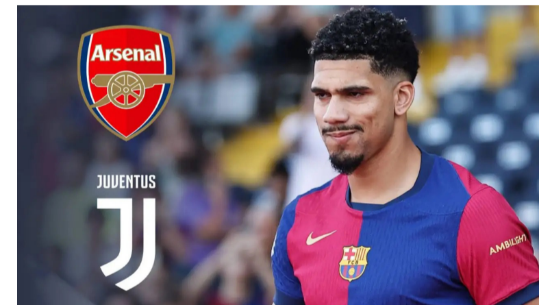
ክልት ክሰብ ወን ስኩቡ ዘሎ ተጸዋታይ ክሰብ ኮሞኒካሽን ተሰብሩ። እዚ ጀርመናዊ “ኣብ ጋንታይ ክጸንክ እዩ ዝደለዮ ምዃራ ኣይ ክብ ዝገበሩ ተኸላኸል፡ ብጠራኽ” ኣለ። ብጠራኽ ወገኑ ክብ መገ-ጸዋቲ ተመላሲ ሓንቲ ጸወታ ኣቐይሩ ዘሎ ኣራሆ፡ ብጠራኽ

እዚ ኮሞኒካሽን ጸዋግይ ባርሴሎና ሃሊ ፍላጎት ዝ ክጽፍ ጃንቲክስ ቀልቢ