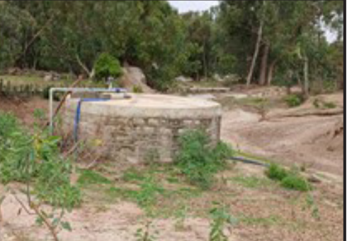
ዓላ ቁጽሬ 2