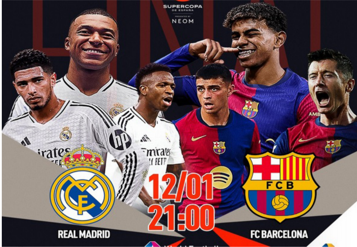
ሓደሽ መገ-ጸዋቲ ዝጠየጠ ማዳታን ኮሚሽን ገዳዳ፡ ከሎም ተጻወታ ድለዋት ኣለው።

ማድሪድ ለሚ ምኹን ንዝገም ተጸዋታዮ ለካ ሞድሪች ዘይኸገሙሉ ትክክል እዩ። ተግዳጋ ኮሞኒካሽን ጸዋኦ ሞድሪች ዛገት ክብዘ ጸወታ ምዃሮ ወገን ኣይኣብዩ። እታ ጋንታ ክምን ንገሰል ዓመት ክብ ጸወታ ተኣላዩ ዘሎ ጸብድ ኣላየን ኣብ ወቅቲ