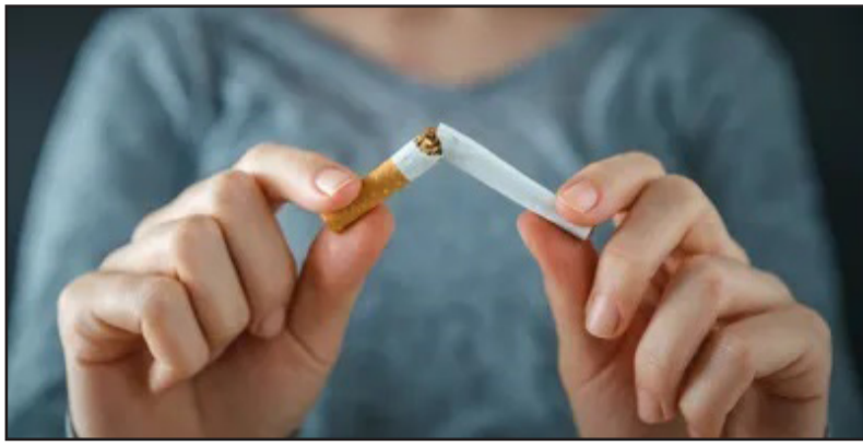
ሰከቡ ዘኣትዎ ናቶን ትኣብ ዘለዎም ጸገማት ጥዕና ክልዕልን ክትሓትን

እዚ ብምኣተኻ ሺጋራ ዝኮበበ ምጽጻር ስምሪ ብምጠብን ኣቲ ሰብ ንውሽጢ