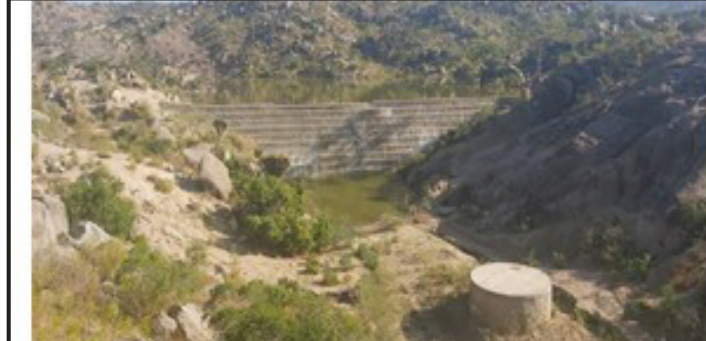
ዲጋ ደቂ ሹሓይ ኣብ ትሕትኣ ተኸላኒት ዘለዎ ዓላ ቁጽሬ 1

2. ምሕደራ ኮማንዳ ማይን ጽሑፍን - ኣታ ኮማንዳ ኣብ ኣቐውማኡ ጀምርኩ ንኣሳንገራ ማይን ማይ ኣቐውማ ኣርቲ ዓይ እትውክል ክኸውን ይግባዩ፡ ብዘበኻ ኮኔ ናይታ ትቐውም ኮማንዳ እትን ሰላት ሰላ ደቀኣሳብ ክኸነ፡ መምርሒ ምርጫ ኮማንዳ ማይን ጽሑፍን ደኻነቲ፡ ኣብ ዝወሰነ ስኽን ኣቐውማ ኮማንዳ ማይን ጽሑፍን ደቂ ሹሓይ ብወሳኽ እንተተገምገሙ ተሳታፍኑት