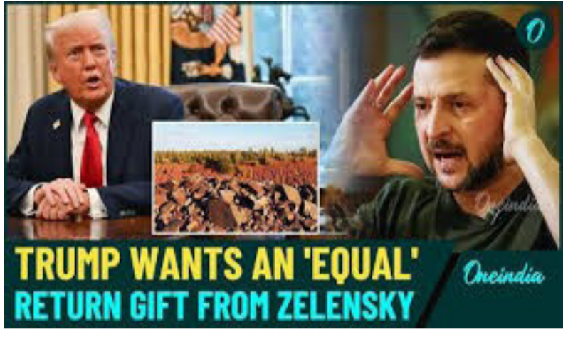
TRUMP WANTS AN 'EQUAL' RETURN GIFT FROM ZELENSKY

ከናት የክሬን ኣብ 2022 ክብ ዝጀምር ንደታር ጥራይ፣ ሃራት ምዕራብ ልዕሊ 380 ቢልዮን ዶላር ዝምገኡ ወተሃደራዊ ኣጸጥር ገዢታት ብመልክዕ ሓገዝ ከምዘገቡኦም ኢሞም ጸብዮት ወሲኹም ይጠቐሱ።