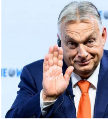
ኮሎናይን ግንኛኛታ ሕቶ ከምዘቐየሩ ቀንጺ ሚኒስተር ሃንጋሪ ስክሳዮር