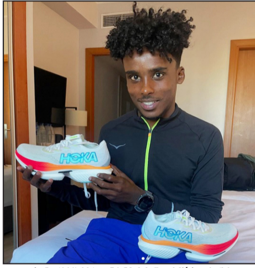
ምስ ሆስፒታል ክኣል መፍሪ ናይ ጉዳ መግራ ሓይሻ ስምም ገደብ