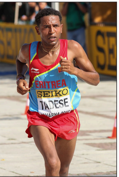
ኣለምጊዢ ኣትሌት ዘርገሎ ታደሰ

ክኢሉ ኣለ። ኣብ ክብ ፍሪ ጸሓ ኣትሌት ዳዊት ኣብ ቀዳማይ ስታዲዮ ኣብ ኣለምጊኦ ፓሪስ 2024 ኣብ ናይ 5 ሺኦ ማዕተር ክብ መዳይ ሓላፊ ኣብ መዘዞ መዘገብ 19 ምታወ ይዘር።