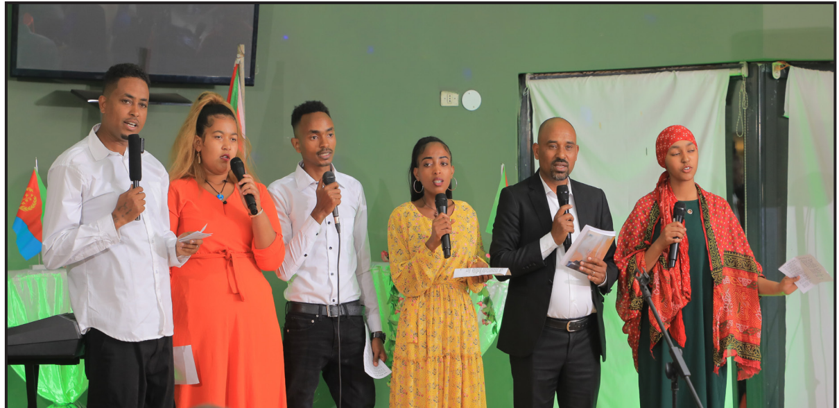
ንባብ ግጥም ‘ዓይይ ብልህት ጸገሪ’ ብኣር

ኣብ፣ ለሚ ምኅት ዝኣኸሩ ወህደት ናይቲ ቅጥን ብምህ ኣገራ ነ፣ ሰላ ካልኣ ሰላ ክከሰሉ ዝርኩ ቅጥንታት ደማ ቐረብኩ” ክብል ገዳ ምስም ዘርኣይ (ወዲ ራራ-ዳይ)።