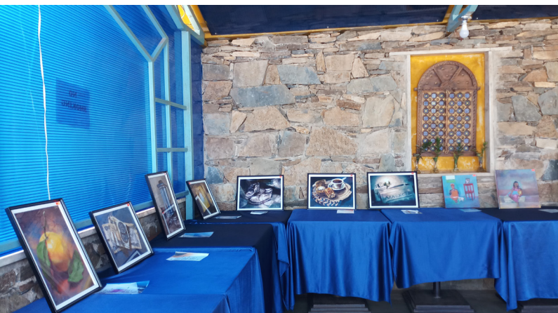
ገለ ካብቲ ንምርኣት ዝቐረበ ቅጥንታት (2)

ግጥም ሰባ “ወዲ ሰባይ እዩ” እትብል ግጥም እዩ። አብ ገለ ክፍል ሕብረተሰብ “ወዲ ሰባይ” ዝብል ጸሓፊ ንሓይ ስርዓት ዘይብሉ፣ ሰዓይ ዘይሰዓይ መሰሪሉ ዝበደሉ፣ መካተር ወዘተ. ዝበል እዩ። በጽዓትን ኣይታት ከሉ ከይገኘን ከሉ ከይለገን ደቀን ብክሰርዓት የዕብዮ። ጸዮኹ ስነ-ጥበብ ካብ፣ ጸር ዘይጸር ምፍጥር ወይ ምቕራብ እዩ። በጽርዘ. ጸሕ ኣብላላዚ. እታ ግጥም ከፍቲ ትብል፣ ወዲ ሰባይ፣ ምኅራፍ ዝኸበን ጽብላይ ተቐርብ።