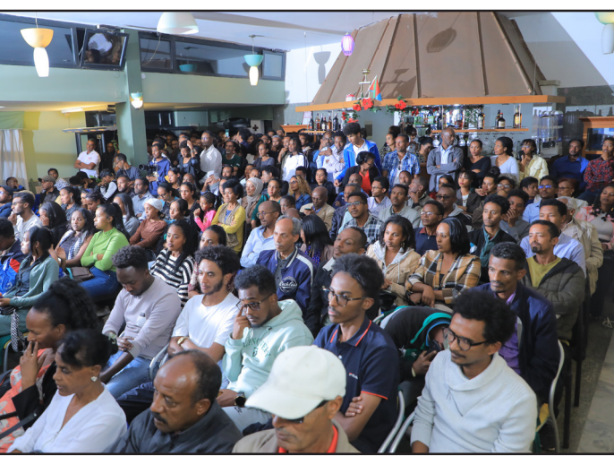
ተሳተፍቲ መደብ ንባብ ግጥምታት

ግጥም ግጥም ኣብርም ብወገ። “እቲ ዝተገለጸ ስነ-ጥበብ ኣብ ንኣይሰጥ ካብ፣ ዝተገለጸ እቲ ዘይኮነ ደብኸ። በ. መላሪት፣ አብ ዝተገለጸ