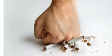
ልዋም ሞጎስ (አባል ሚኒስትረ ፍትሒ)

ብተወሳኺ፡ ነብስኻ ብስራሕ ጽሙድ (busy) ምግባር፡ ስራሕ ምፍጣርን ግዜኻ ምውዳብን እውን ኣጋዚ ይኸውን።