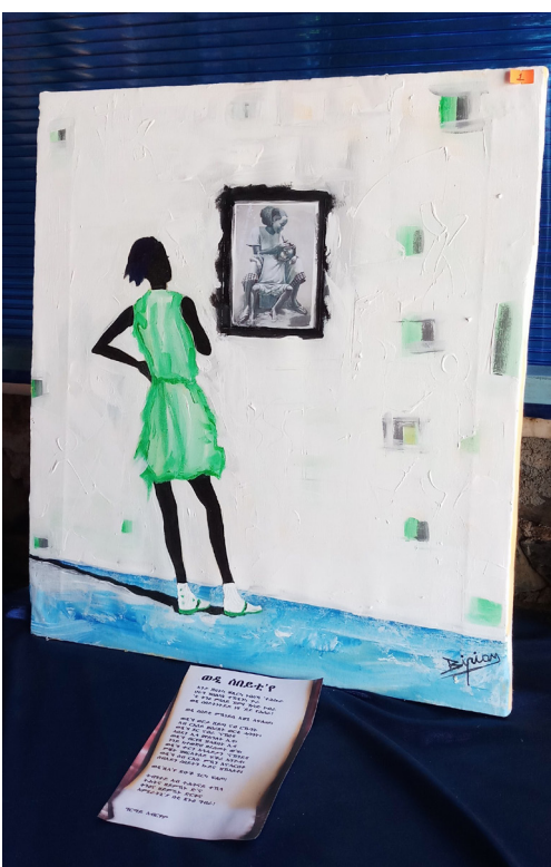
ቅጥን ካብ ግጥም ‘ወዲ ሰባይ’ ሓይ ድሕሪ ሓይ ዝተገለጸ ግጥምታት ተሰብዮ። ካብ ግጥምታት ግጥም ዘመ ተገይሩሉ ዝተደረገ እውን ኣይዩ። አብ ስነ-ጥበብ እዚ እቲ ጸር ናይ ዘመን ግጥም ደርፍን ወህደት እዩ። ቃላት ዘመ ምስ ተሰጥዖሎም አብ ልብ ዝርኩፍ ስሜት