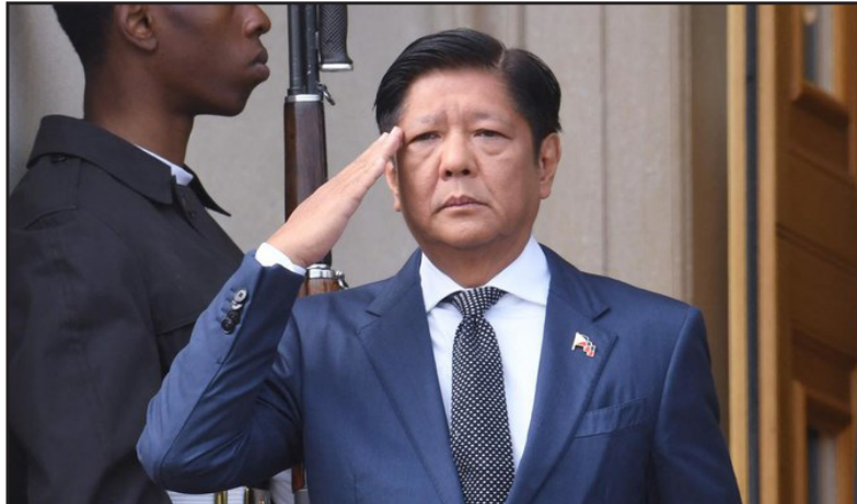
ፕሬዝዳንት ፊሊፒንስ ፊርዲናንድ ማርኮስ ሰራዊት ኣመጽኦ - ናብቲ

ኣብ መገን ሃይት ኣውሮጳን ቻይናን ተኸታቲ ዘሎ ግንዛዜ ናልፊዮ፡ ኣሉታዊ