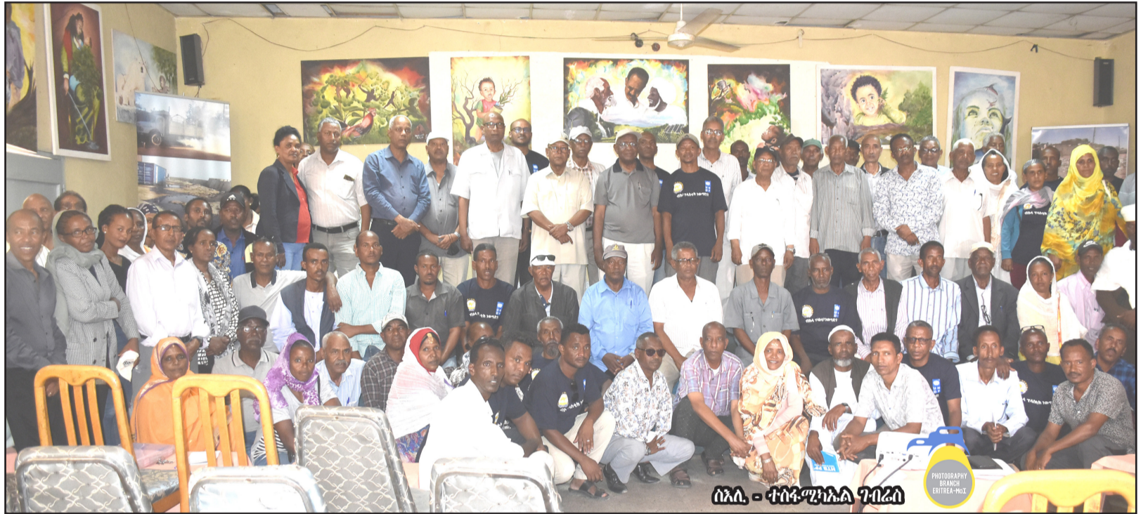
ሰጠን - ተቀባይነት ገበያ

ክሰብ 900 ሚሊዮን ከምዘገገገ እዚ ብገደብሉ ተመሳሳይ ምስ ዝወጠ ከኣ - ንኹሉ ጠቐሱ ሃገር ዝምልከት ክኸውን ከምዘገገገ ተቀብሩ።