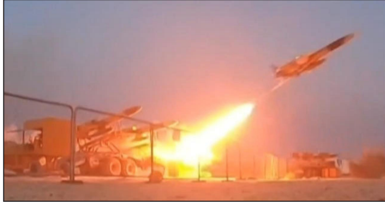
ቐንሳ ኢራን ናይ ደርፍኻን መጥቃዕቲ ድሕሪ ምክሮም ኢራን ከም ግብረ-መጻሕ ዝኣሉ ሰንበት ናብ እራሳን ልዕሊ 300 ሚሊዮን ደርፍኻን ከምዘመጸጸትን ከምዘሰደደትን ዝዘር እዩ። ዓላማታት ብገበጻ ከምዘወቐቡት

እራሳን ኣብ መጀመርያ ናይዚ ወርሒ ኣብ ሰርያ ኣብ ልዕሊ ዝርከብ ህጻ