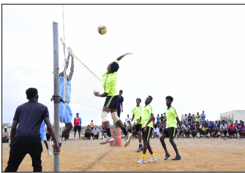
ደማ ብተመሳሰሉ ወጽኢት አብ ልዕሊ ዓይ ርሶ ዓወት ክመገቡ እንዘለዎ፡ ባርዕ ከአ ንመድሕን 3-0 ስድሚኡ። 2ይ ዘርፍ ቅን ስፖርት እዚ ተወርቆ ሓይሊ፡

ሹቶ ባርዕ 140 ተግባራት ክውጽኡ ክኣሉም፡ ኣልጊን ምስ ዓይ ርሶ አብ ዘሰላጸዎ ጸወታ ብሓይል ህልኻን ተሰገዮ ምስክርዎል ዝነይሉን ከዓሳሉ ናብ ልዩነት ክልቲኡን ጋታታት ክልእኻ ተራእዮ። ናይ ቅድሚያ ሰባት ጸወታ ብይሻቶ ተወዳኢ፡ ድሕሪ ሰባት አብ መገል 63 ደቂቅ ላብ ግጥም ምዳይ ርሶ ሹቶ ስለ ዘዩራሊ ዓይ ርሶ ተግባራት ክከፈሉ ክኣሉ፡ ብድህ ምስ ቶር አብ ዘዩራዎ ጸወታ ናይ 90 ደቂቅ ግጥም ሹቶ ከይተመገበሮ ተዘመ።