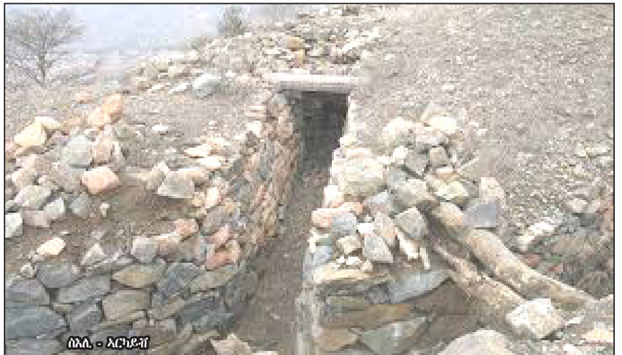
ሰጠን - ኣርካይቲ