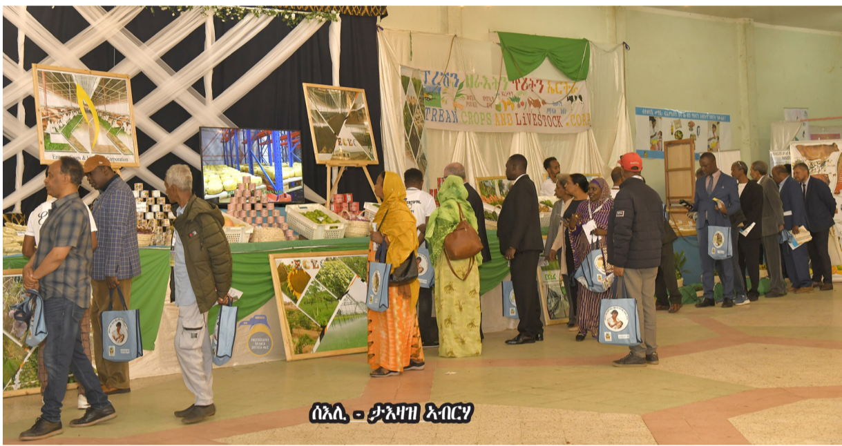
ሰንበት - ትኩረት መርኣዮ

ኣብ ኮርፖሬሽን ጥሪን ዘራጅትን መግለጺ ኣብገብሮ ቀጠለ ዘሎ ትኩረት መርኣዮ ናይቲ መግለጺ፣ ጸብ ወጻኢት ጸብ ስጋ ወጻኢቲ ኮሚሽን ወጻኢት ኣተሞልትን