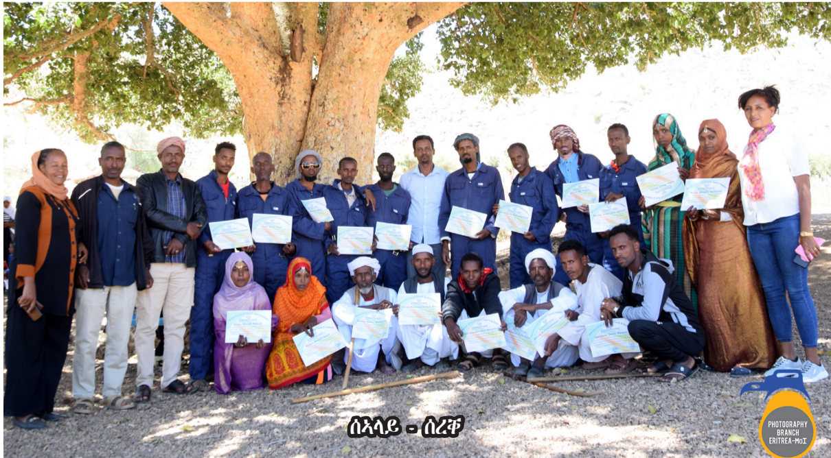
ስኣላይ - ሰረቆ