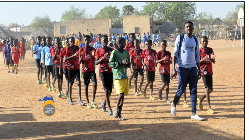
ስኣላይ - ሰረቆ