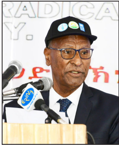
ሚኒስቴር ኣኒራይ ቦርህ

ብ16 መስከረም ዝሆል ዓለምላካዊ መዓልቲ መግቢን ብ17 መስከረም ዝሆል ኣህጉራዊ መዓልቲ ምውጋድ ድኻብን ብተኩር ኣብ ሆቴል ማይ