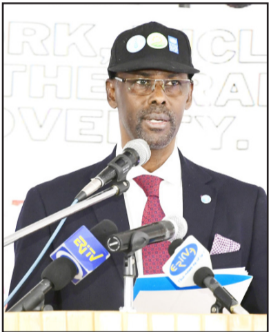
ሚኒስቴር መሓመድ ኣው ዳር

ኣካሊ ብድመቓ ምድላዎት ተዘኪረ፡ ዓለምላካዊ መዓልቲ መግቢ “መሰል ንመግቢ፡ ንዝሓሸ ህይወትን መጻእን” ኣብ ትሕት፡ ዝሆል ቲዎ ክትባከር ኮሎ ኣህጉራዊ መዓልቲ ምውጋድ ድኻብን ድግፍ “ብቐጥታ ተቐጺሮ ዕቡዩን ምውጋድ ድኻብን” ኣብ ትሕት፡ ዝሆል ቲዎ ዝተሓረፈ ርብሪብ ተባህሪ፡ እዞን ቦላት፡ ብምትሕብር ሚኒስቴር ስርገላዊ ንግሥት