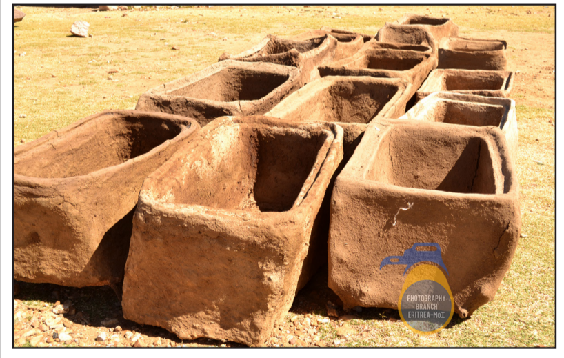
PHOTOGRAPHY BRANCH ERITREA-MQZ

ገደአትን ኦቦ ኦቦ ኦቦ ብላ ስምዶኤ ስምዶኤ ስምዶኤ ስምዶኤ ስምዶኤ ስምዶኤ ስምዶኤ