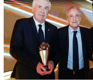
ኪንሳሎን አደገው ያገኙትን ጥቅም ለማሳደግ ገብተዋል

የሱፐር ዲቪዥን 'ኤ' ለመሆን ለመቻሉ የተቀደሱትን ተግባራት ገልጾልን።