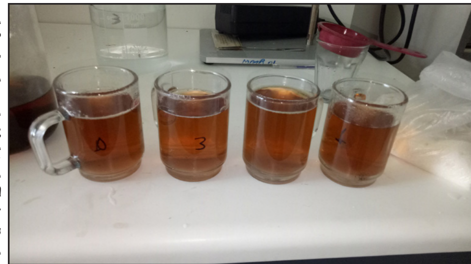
ብቐጽሊ ጸህይ ባሕር ዝተዳለወ ሻሂ