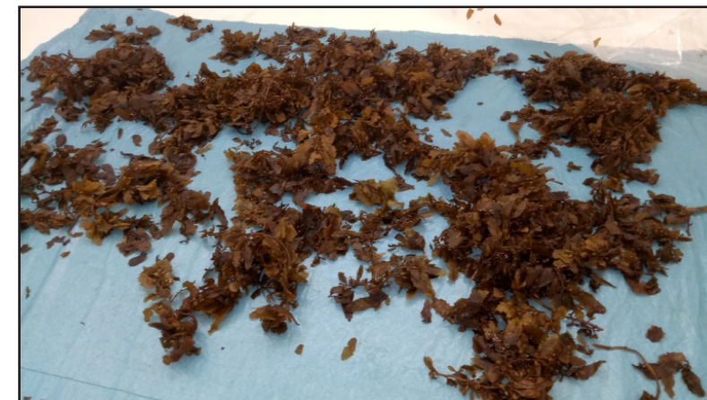
መርከብ ምስታታት ቡናዊ ጸህይ ባሕር

ጸህይ ባሕር ኣብ ክገበሉ ዝርከብ ጥቅሚ፡ ማዕድናት ዝኾነሉ እንተኾነ ንደቁሰብ ተጻፊት ዝኾነ ከበድቲ ሓዲን ናይ ምስታታት ምዃጻጻን ባህር ከምዃጻጻ ይገለጻ። እዚ ደማ ኣብቲ ጸህይ ባሕር ዝኾነሉ ማዕድናት መሬትን ብኩሕ ኣለዎን ዝኾነሉ ምስ ዝኾነውን እዩ። ካብ ማይን መሬትን ከም ኣርሳኡ ካደመጻም ለደን ማርኪራን ዝኣመሰሉ ከበድቲ ብራታት ክኾነሉ ይኾነል። ካብ ዓይነታት በናዊ ጸህይ ባሕር ከም “ኩልፕ” ምስ ቀይሕ ወይ ቀጠል ጸህይ ባሕር ክኾነሉ ከሎ፡ ዝሰላ መጠን ከበድቲ ብራታት ከምዃጻጻ ተመራመርቲ ስብዮት ይኣኣል።