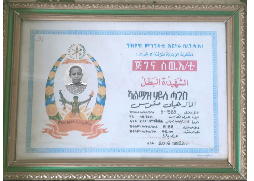
ሰው አዳዲስ አዳማዝ ሃይለ