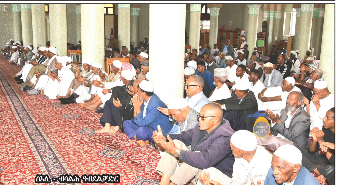
ሰኔ 20 - በቤተ-ክርስቲያን ደብረ-ላህለ