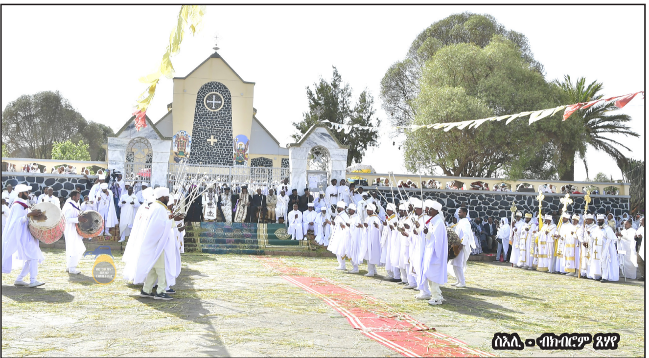
ሰኔ 20 - በቤተ-ክርስቲያን ደብረ-ላህለ

ስላሰርገ ህዳም አብ መወገዱ፡ ኣሰራርባዎ ዜጋ ንድረ-ቤት ሰማእታት ክክበን ብዩኤንን ገዝብን ክትገበን እቲ ዝተተገቦት ከምዘከብኡ ኣገዝዘዎም።