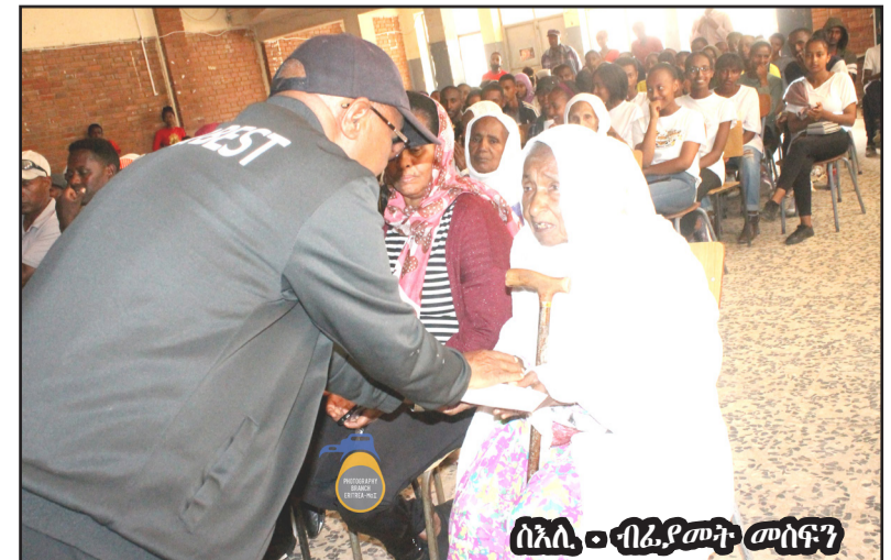
ሰኔ 20 - ብፊያውት መሰፍን