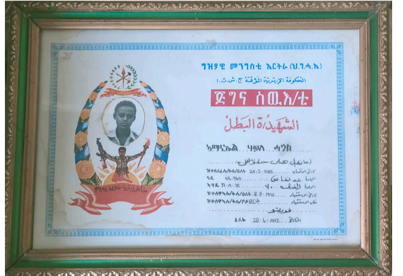
ሰው አዳዲስ አዳማዝ ሃይለ