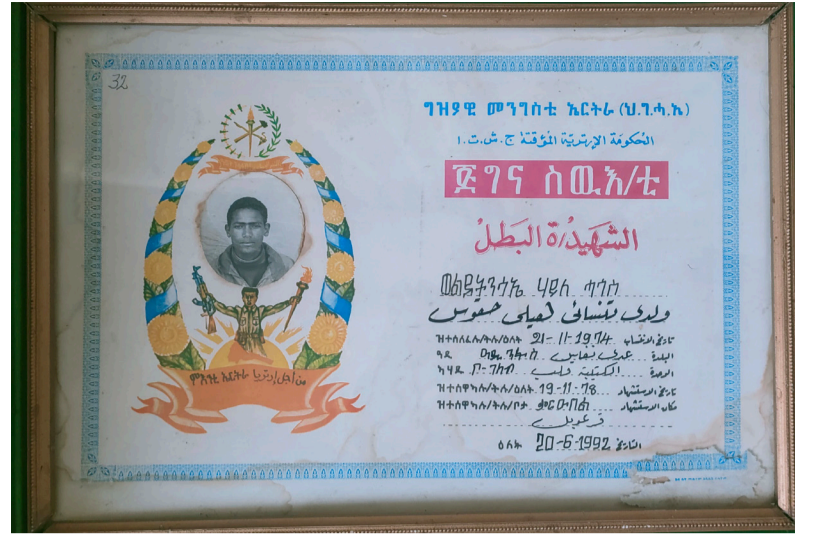
ሰው አዳዲስ ወልደሚርያም ሃይለ