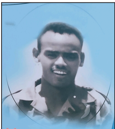
ሰው አዳዲስ መርሃዊ ሃይለ