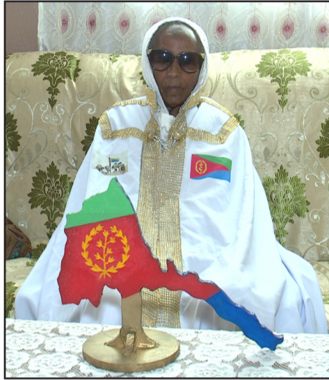
አደይ አምላሳት ወልደሚርያም