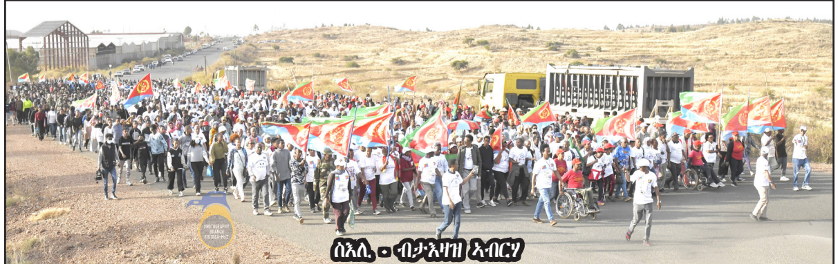
ሰኔ 20 - ብታሕሳስ ኣብርገ

ኤርትራ ምስ ሰማእታት ብዩኤ ሕልና ዝረከቡ ከምዘከብኡ ብምባህ፡ ስላሰርገ መደብ ሰማእታትና ንምዝርን መሰሪድ ንምሕዳን ከምዘከብኡ ገለጸ።