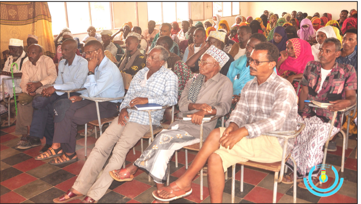
መደባት ነቲ ናይ 2024 መግቢ ባይታ ስልጠናታት ብካየዱ ውግስ ክህሉ ክምሕሩ-ሉ ደግ ተገለጹ። ተሓቲቲ ስግር ዝህተ ማይ