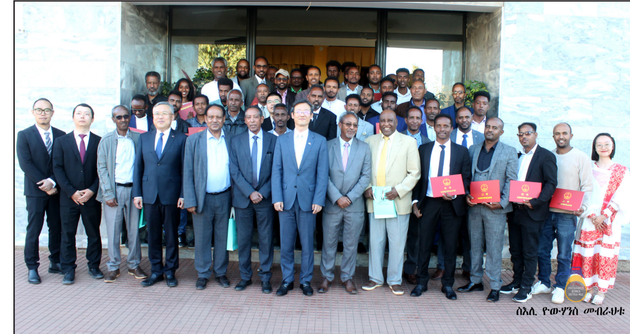
ስኢ. ዮውሃንን ሙብራህቲ