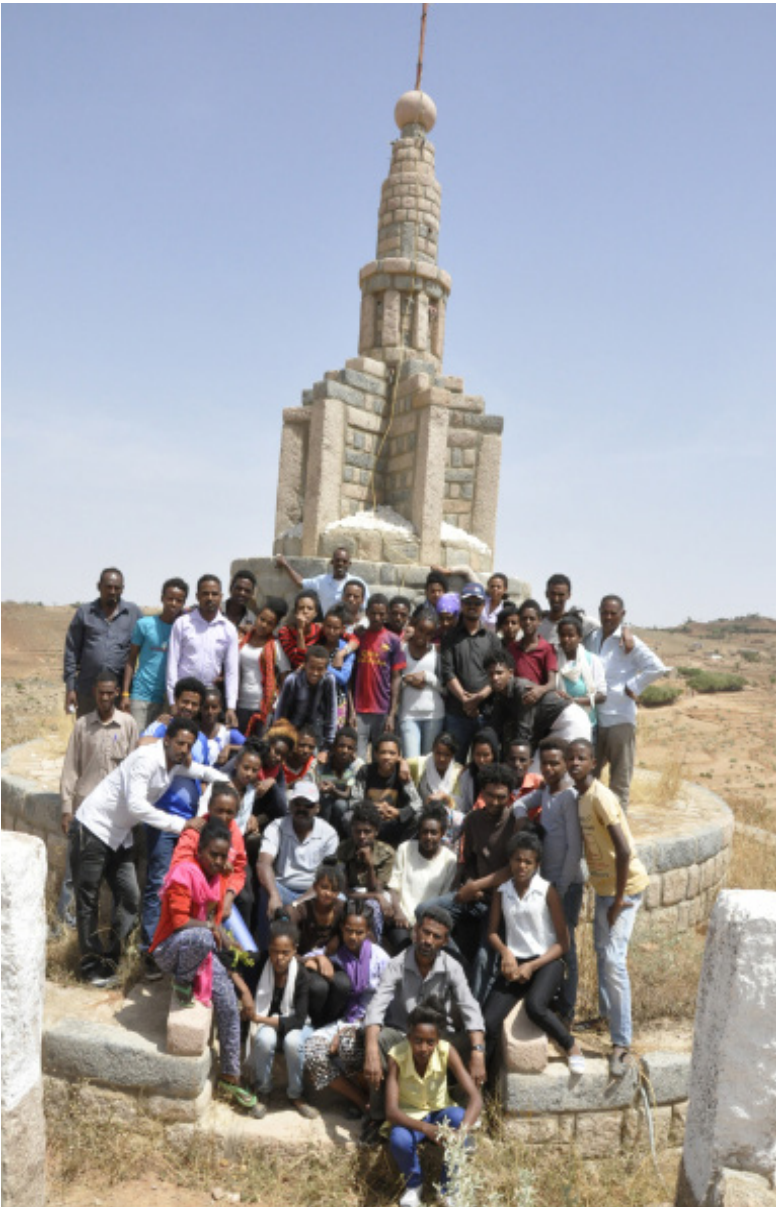
መግዛእታዊ ስርዓት'ውን ኣመድ ዘልሓሰ እዩ ነይሩ።

ካብ መስመር ዓፍጻሚት-ናቕፋ ንዮማን ዘሎ ኩርባታት፣ እቶም ንሰራዊት ደርግ ዘማኽሩን ዝመርሑን ዝነበሩ ሶሻዮላዊያን ዝተማረኹሉ ሻባይ መንደር ብማዕዶ ይርኣ። ካብ ኣፍጻሚት ቍሩብ ሰጉም ኣብልካ ግምግም ምስ በልኻ፣ እታ ወዲ ትኹል "ናደው ዝተቐበረላ ዓባይ ሕሎም" እናበለ ዝደርፈላ ክሳድ ዓድሹሩም ትርኩቤ፣ ኣብቲ ዝባንን ሰንጭርን ብዙሓት ዝሓረራ ታንክታት ዛሕ ኢልን ኣለዎ። እቲ ካብ 17-19 መጋቢት 1988 ዝተኻየደ ደምሳሲ መጥቃዕቲ ህዝባዊ ሰራዊት ነቲ ዝበለጸ ንብረትን ሰራዊትን ደርግ ዝበልዕ ባርዕ ዝተኣገደሉ ቦታ'ዩ። እቲ በርቃዊ መጥቃዕቲ 'ኣመድ ደብ ናደው' ጥራይ ዘይነገ ተሰፋ ናይቲ