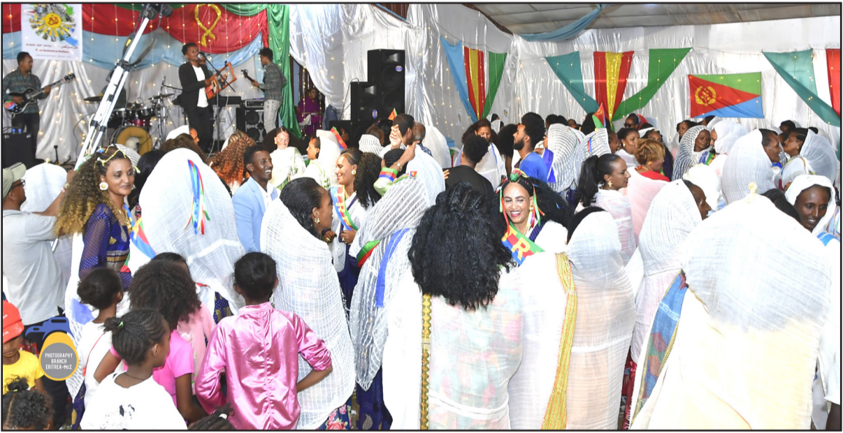
3/ዞን ዕዳጋ ሓሙስ - ምም/ክባቢ ሓዘሓዘ

ብመላኒ ተክራታ ኣቶ ተኻላይምኻት ብክጽግን ብከዘገቡን ጸልዎ ናይቲን ከበንቲ ማይ - አብቲ ዞን 3,160 ሄታር ብኡትምእትን ፍራታትን ለምው አሉ። አብ ምዕቃብ ማይን ሓመድን ደማ 70 ሺክ ሄታር ዞን 58 ሺክ ሄታር ክበሪን ክህራክ እገለጹ 7 ሺክ ሄታር ተመደሚዱ ብርግጥን ተመደንዮን አብ 73 ቦታትን ዓይነቲ ክበሪታት ተሰራኩ።