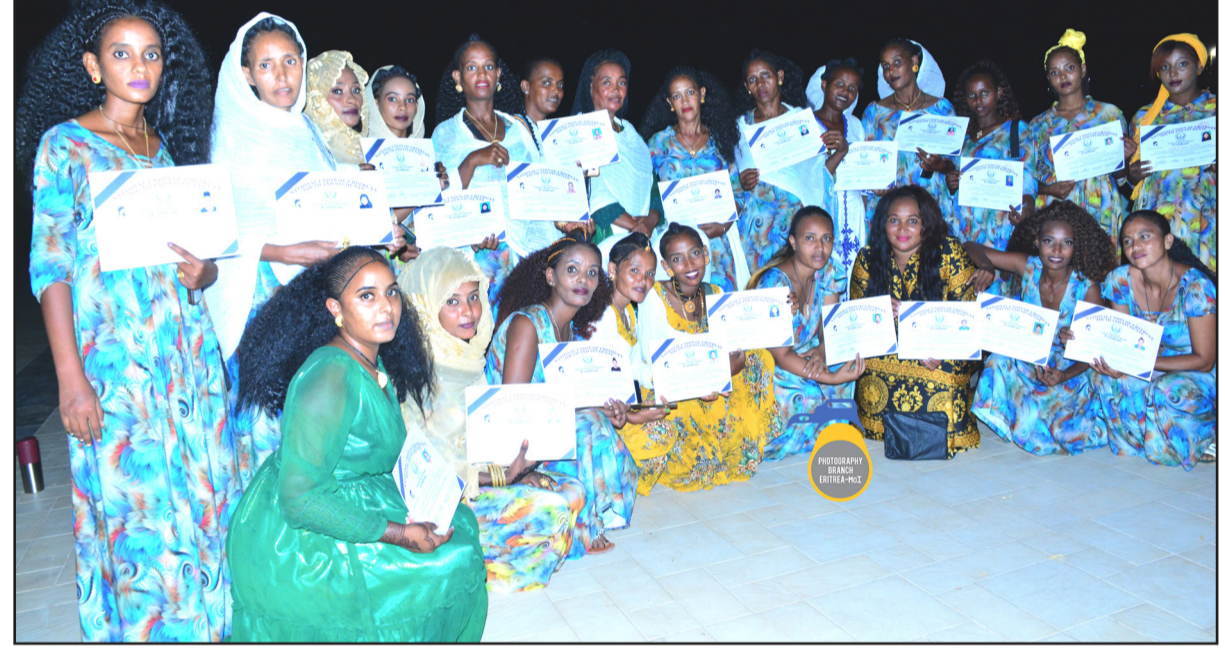
በል ናጽነት ንምደማቕ ክደድ ካብ ዝደቦ ምደላዎት - ዞባ ደቡብ (ሰላ. ብመሪሕ ተገራይ)

ዘሎ ኣብርክቲ ደሕሪ ምንገድ፡ ምምሕዳር ዞባ ተመራሲ መደብን ንምደጋፍ ደልው ምዃ፡ ኣረጋገጸትሎም፡ ቤት-ጽሕፈት ምግመትኤ ንኣሰ ዞባ ባዳ እውን ኣብ ምምሕዳር ከበ. ኣምሰሚ ብሰራሕት ስቃ- ዘሰልጠን 22 ደቂ-ኣንጎላት ብ14 ግንቦት ኣመርፍ፡ ኣብ ካልእ ተመራሲ ዜና ናይቲ ዞባ - ኣብ ንኣሰ ዞባ ጸሓቲ ብምትሕብር ጨንፈር መንገሳዊ ስደን ማህበራዊ ደሕነትን ምምሕዳር ንኣሰ ዞባ፡ 14 ጽጉማት ብጽላቡ ተጣዩሶም፡ ብ10 ግንቦት ኣብ ጀምራ ኣብ ዝተገደደ ስብርባት፡ ወክል ጨንፈር መንገሳዊ ስደን ማህበራዊ ደሕነትን ዞባ ሰቃ/ባሕር ኣቲ ኣምምል ዐሰማኑ ማህበራ-ቀጠቤ መገብር ዘረጋታት ብካልኻ ናይ ጽጉማት ደማ ብጽላይ ንምምሕዳር ደሰራ-ሕላ ኮምፕራ ገለጸ፡