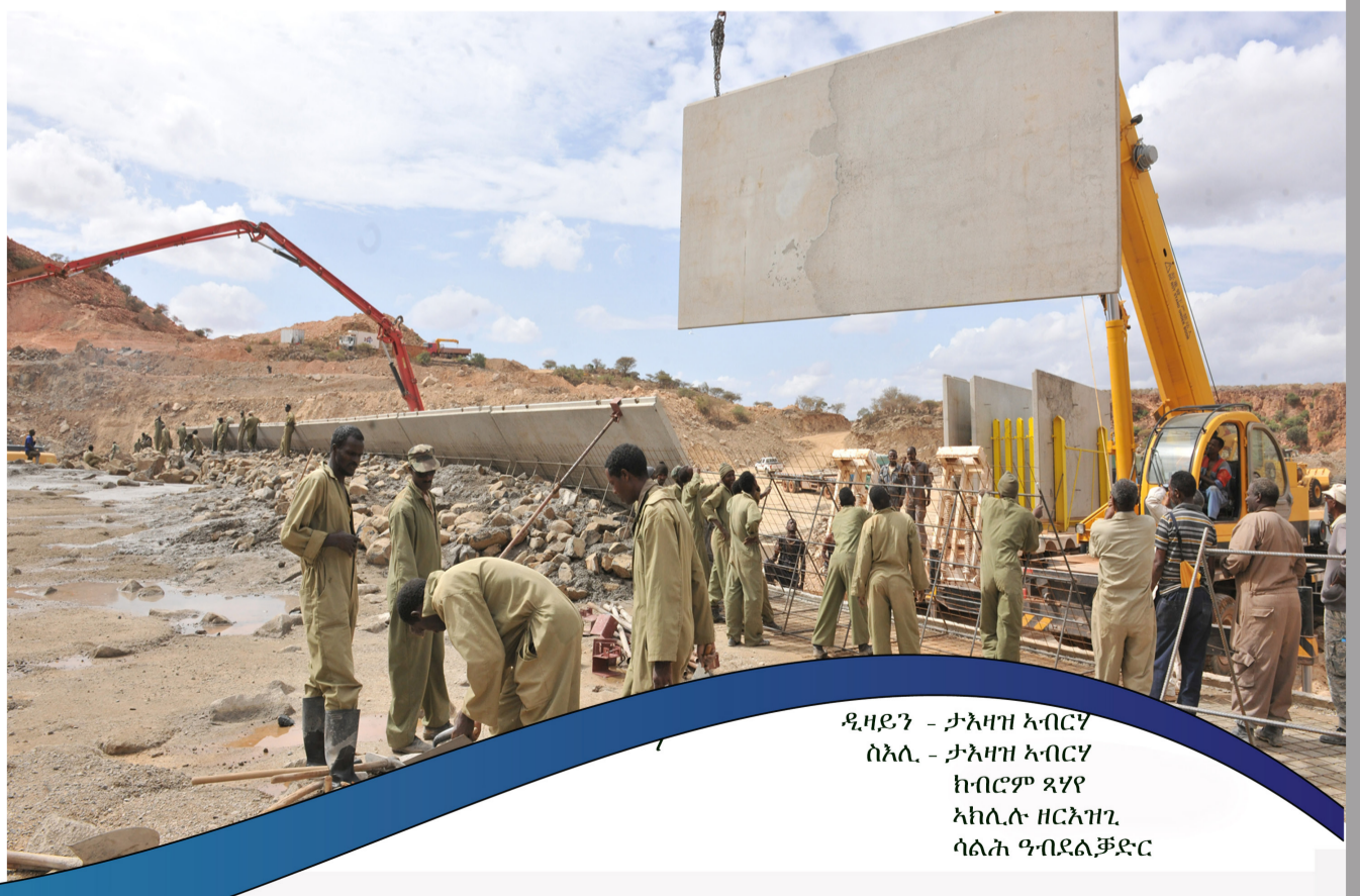
ዲዛይን - ታላላቅ አብርሃ ሰላሊ - ታላላቅ አብርሃ ኮብሮም ጸሃዩ አክሊሉ ዘርአዝጊ ሳልሕ ዓብደልቻድር