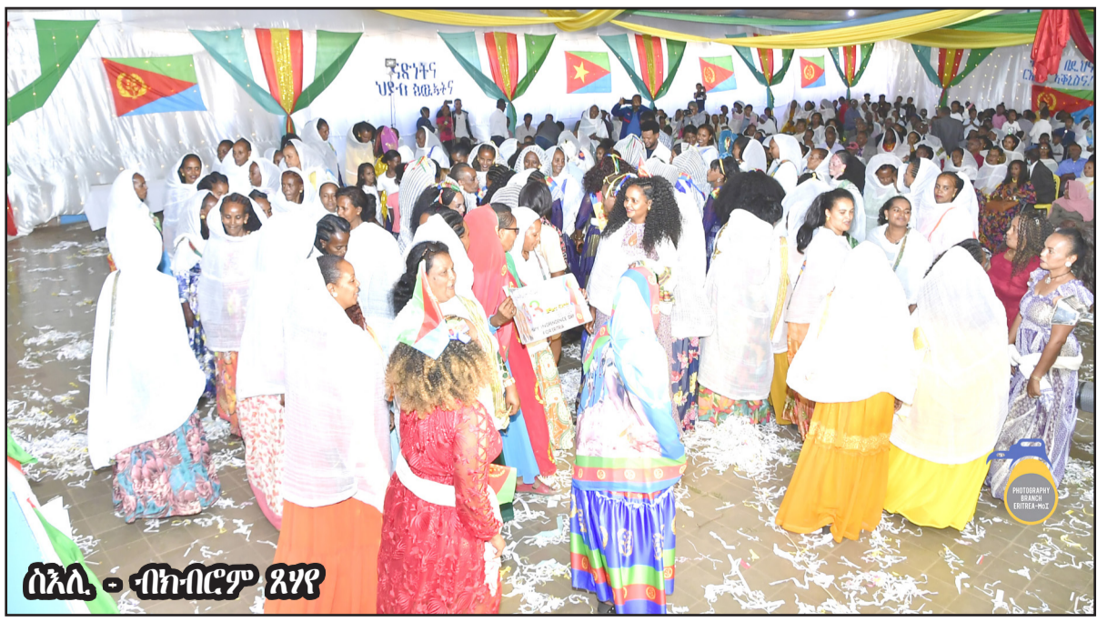
ሰኢል - ብክብርም ጸሃዩ