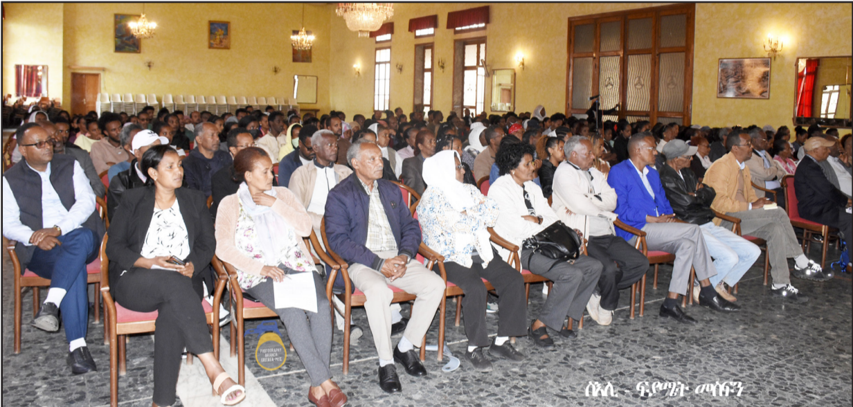
ሰላ. - ዓ.ምገት መሳፍን

ምምህራን ዞን ማእከል ብዙተፈላለዩ ዓውድታት ዘሰልጠኖም 250 አባላት ትምህርት 22 ነሐሴ አመሪቕ።