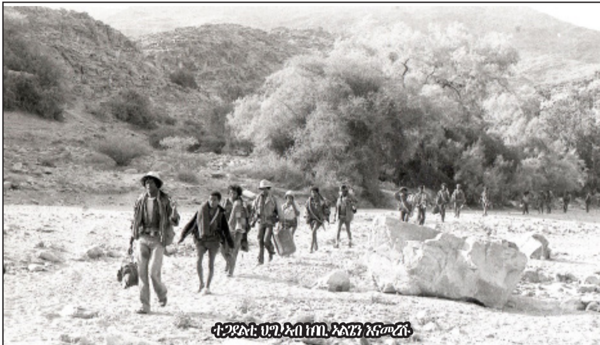
ተጋዳሪቲ ህጋዊ ኣብ ዘጠ. ኣለን እናመረጡ

መልሲ ረሰዎ? ኣለ እናተሰበኩ፡ “ናይ 1980 ተጋዳሪ እዩ” መለሰ፡ “ድሓኡ ተገልጺ ማእቲ ኮኣ ደልጠኩም