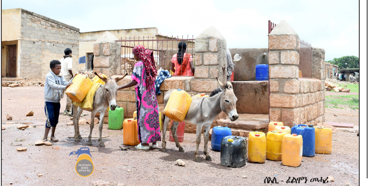
ሰላ. - ፈልግን መሓሪ

ምምህራን ዞን ዓዲ-ፈለሰቲ ካብ ደርገደ 30 ኪ.ሜ ጸገም ደቡብ ደርብ።